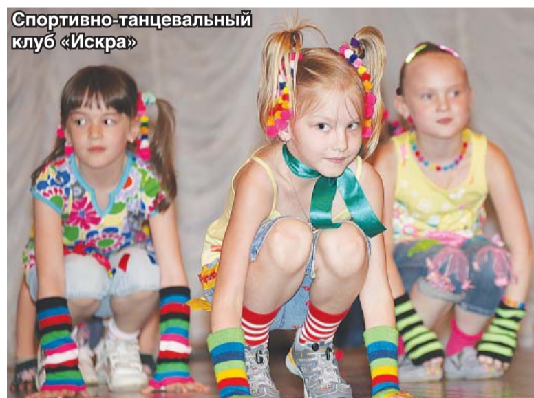
Спортивно-танцевальный клуб «Искра»

танцевального клуба «Искра». У них в танцклассе занимаются ребята от детского сада до старших классов школы. Даже студенты есть. В репертуаре клу-