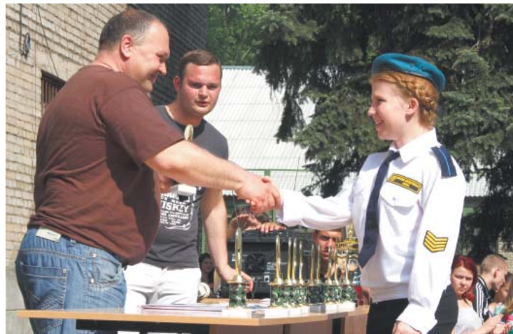
Материалы полосы подготовила Динара ШАТИЛОВА

Как сказал на награждении руководитель Клуба «Воинская дружина» Михаил Федосов, все ребята молодцы: показали настоящий задор и воинскую подготовку! Есть кому защищать Родину! Но... задумайтесь, парни, ведь лучшими были девчонки!