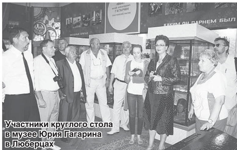
Участники круглого стола в музее Юрия Гагарина в Люберцах

В одном из старейших профессиональных образовательных учреждений России – Люберецком политехническом техникуме имени Ю.А. Гагарина во вторник, 18 июня, состоялось заседание круглого стола на тему «Актуальные вопросы подготовки кадров для обеспечения предприятий». Оно прошло в рамках акции «Рабочие руки Подмоскovie».