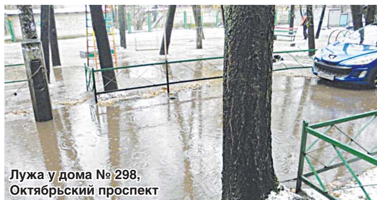
Лужа у дома № 298, Октябрьский проспект