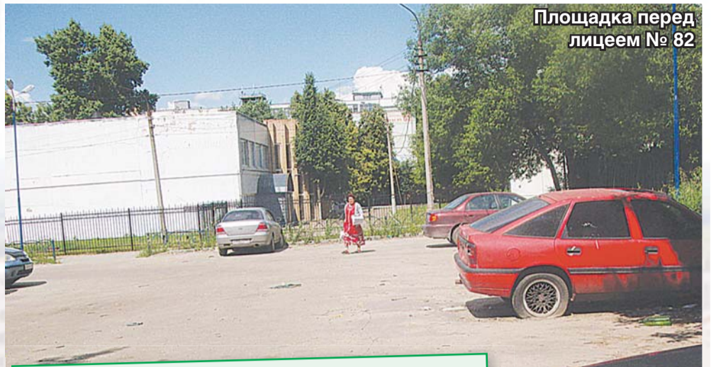
Площадка перед лицеем № 82

– Что я могу сказать? Часто отключают воду – без предупреждения. Дом наш старый, требует к себе особого отношения. Если нет возможности провести хороший капитальный ремонт, то коммунальщики хотя бы почаще к нам заглядывали. Причин этому – масса: то труба лопнет, то стояк потечет.