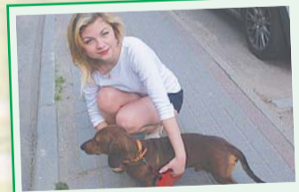
Ангелина, улица 2-я Заводская, дом 17:

– Каждый год работники ЖКХ (преимущественно, уроженцы Средней Азии) косят у нас во дворах траву. Но, товарищи, нельзя же так бездумно все делать! Трава не успевает вырасти, вон уже видна одна земля. Под старыми деревьями появилась молодая поросль – ее тоже под корень. Им, этим уроженцам с их саксаулами, на наши зеленые насаждения плевать. С них-то какой спрос – чужаки, а вот руководство ЖКХ должно понимать, что к чему, а не пускать все на самотек.