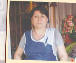
Мая, улица Школьная, дом 3:

– Я чистоту люблю, у меня и на работе всегда порядок – сами посмотрите. Каждый овощ – к овощу, фрукт – к фрукту. Так и дома. В квартире чисто, и в подъезде у нас – тоже все на высоте. Вода просто отличная – не знаю, что это другие жители жалуются. Сама давно в Красково проживаю, мне все нравится.