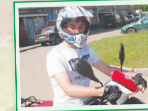
Ираклий, Совхоз, дом 2

– Я чистоту люблю, у меня и на работе всегда порядок – сами посмотрите. Каждый овощ – к овощу, фрукт – к фрукту. Так и дома. В квартире чисто, и в подъезде у нас – тоже все на высоте. Вода просто отличная – не знаю, что это другие жители жалуются. Сама давно в Красково проживаю, мне все нравится.