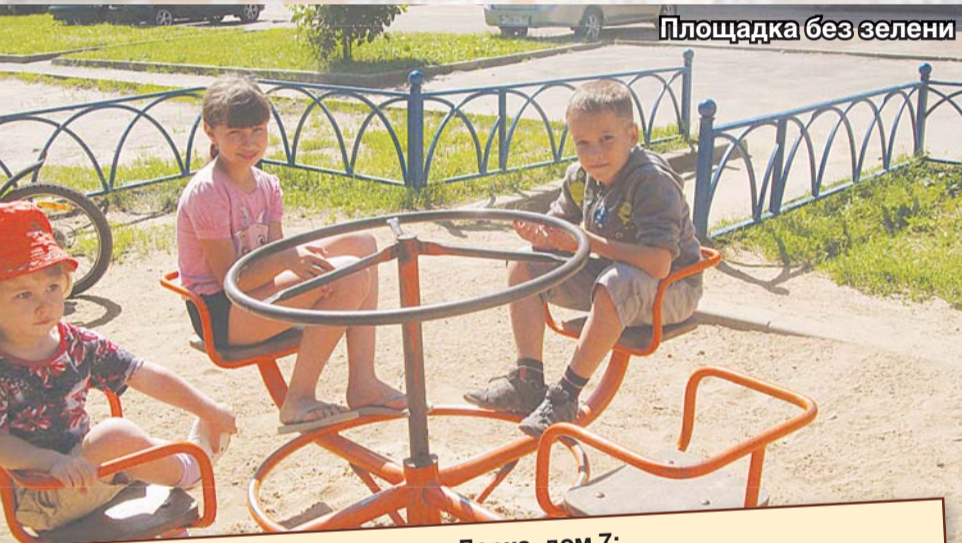
Площадка без зелени

– Женщина, сфотографируйте меня, пожалуйста. Рахмат, сестра. Потом жене газету pošлю – пусть гордится. Я раньше возле дома 24 по 2-й Заводской работал – чисто было. А теперь грязно. Теперь я возле администрации подметаю.