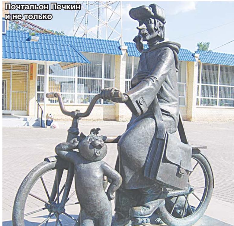
Почтальон Печкин и не только