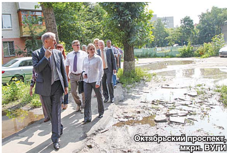
Октябрьский проспект, мкр. ВУГИ