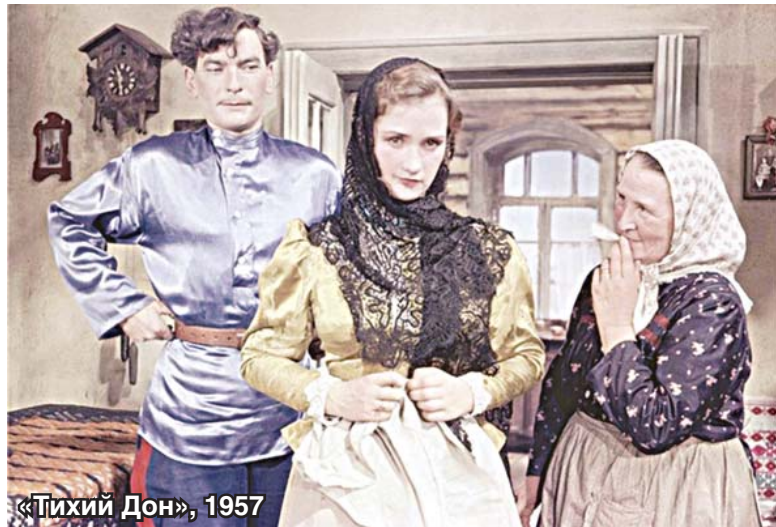
«Тихий Дон», 1957

– Зинаида Михайловна, я знаю, что у вас родился прав-