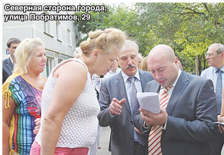
Северная сторона города, улица Побратимов, 29