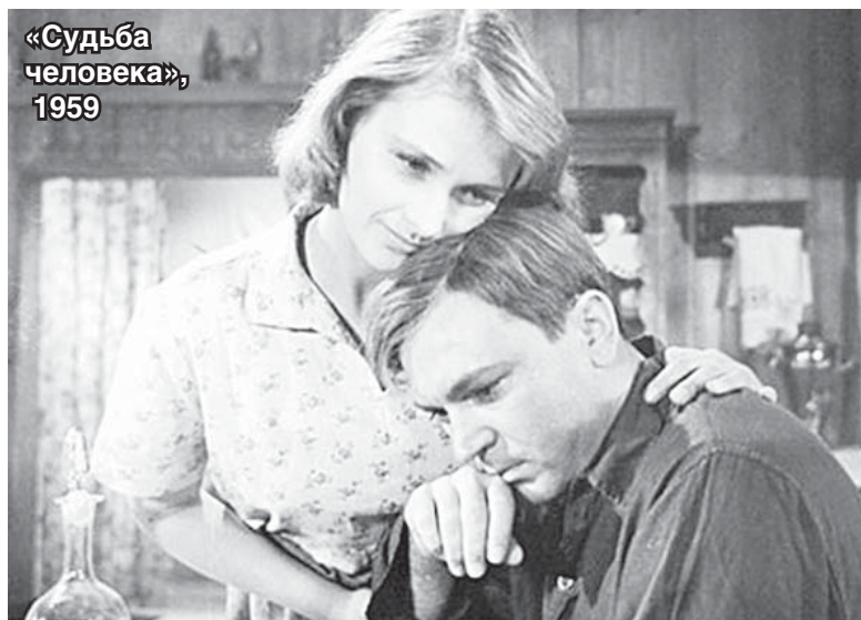
«Судьба человека», 1959

Чиновничье вето нарушил известный актёр и режиссёр Евгений Матвеев, пригласив «опальную» актрису на роль Ефросиньи Дерюгиной в картину «Любовь земная».