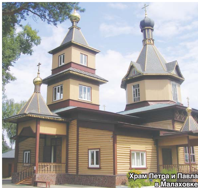
Храм Петра и Павла в Малаховке