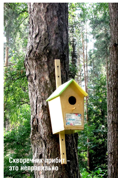
Скворечник прибит – это неправильно

красавца уронили, и у многих уже возникает вопрос: «А есть ли смысл его восстанавливать от очередных побоев?». Может кто-то проверят свое «боевое мастерство» на Мишутку? А не стоит ли этим людям пойти в спортзал или вызвать на ринг самого Николая Валуева?