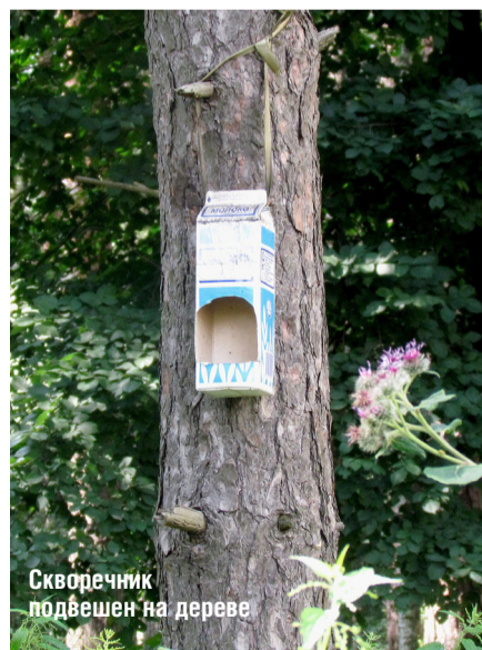
Скворечник повешен на дереве