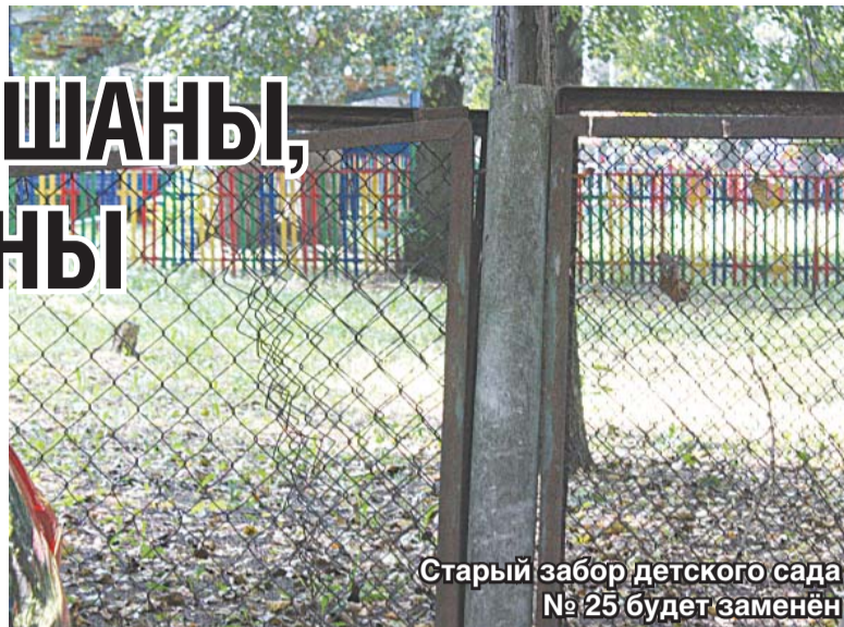
Старый забор детского сада № 25 будет заменён