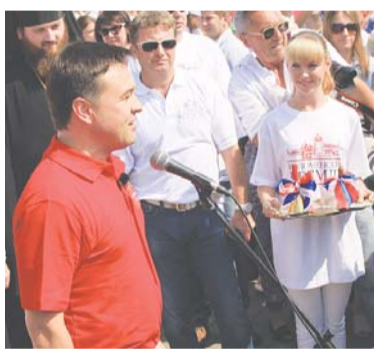
Окончание. Начало на 1-й стр.

Это называется «флэшмоб». А если по-русски – массовая акция в поддержку Коломны как нового символа России. Всероссийский мультимедийный проект «Россия 10», в котором участвуют телеканал «Россия 1», Русское географическое общество, телеканалы «Россия 2», «Россия 24», «Москва 24», «Моя Планета», «Страна», региональные ГТРК, радио «Вести FM», «Маяк», «Радио России», интернет-порталы «Вести.Ru» и «Страна.Ru», газета «Комсомольская правда», каждому