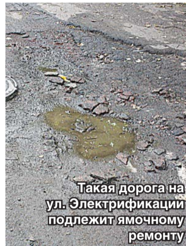
Такая дорога на ул. Электрификации подлежит ямочному ремонту