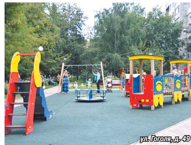
ул. Гоголя, д. 49

Например, на улице Гоголя у домов №№ 13, 18, 19, 38, 48; на улице Пионерская во дворах домов №№ 11, 18, 21; на улице Гаршина у домов № 9 А, корп. 11 и № 18; в мкр. «Птицефабрика» у домов №№ 5, 32, 34 одни площадки претерпели лишь замену не соответствующих безопасности элементов, а другие были полностью демонтированы и утилизированы. А на их месте появились современные, принципиально новые.