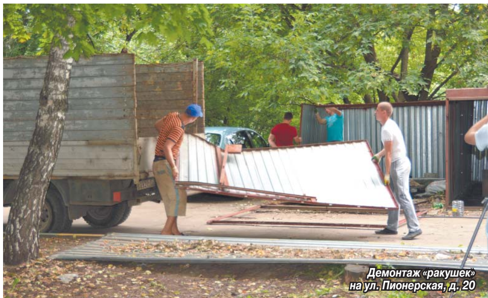
Демонтаж «ракушек» на ул. Пионерская, д. 20

В рамках муниципальной целевой программы по благоустройству неосвоенных земель в Томилино начался снос незаконно установленных гаражей-«ракушек». Демонтаж их прошел на ул. Пионерская, д. 20 и в мкр. «Птицефабрика», д. 11.