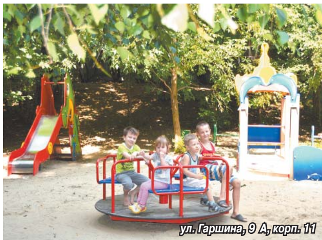
ул. Гаршина, 9 А, корп. 11

Во-вторых, игровые площадки – это неотъемлемая часть жизни ребенка и его родителей. Все лучшие детские воспоминания связаны с играми во дворе, друзьями из соседнего подъезда, веселыми развлечениями. Поэтому наш Глава уделяет такое внимание привлекательности игровых комплексов: они должны быть яркими, красивыми, развивающими детей и вызывающими у них желание