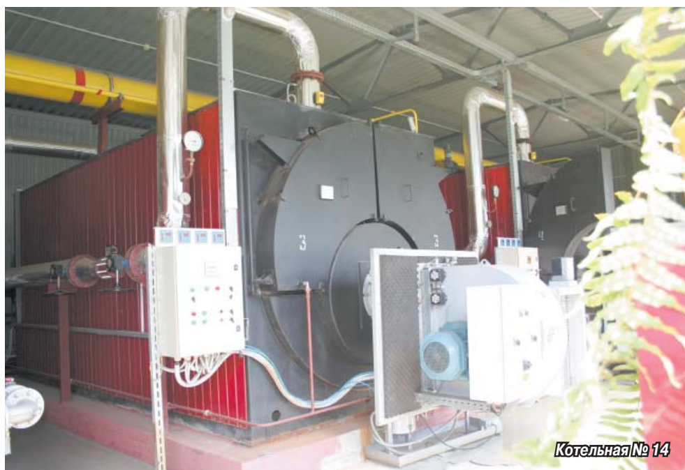
Котельная № 14

Лето подошло к концу... Но подготовка поселка к зиме остается главной в работе администрации. Особое внимание уделяется мероприятиям, которые идут в котельных, на теплотрассах и сетях горячего водоснабжения.