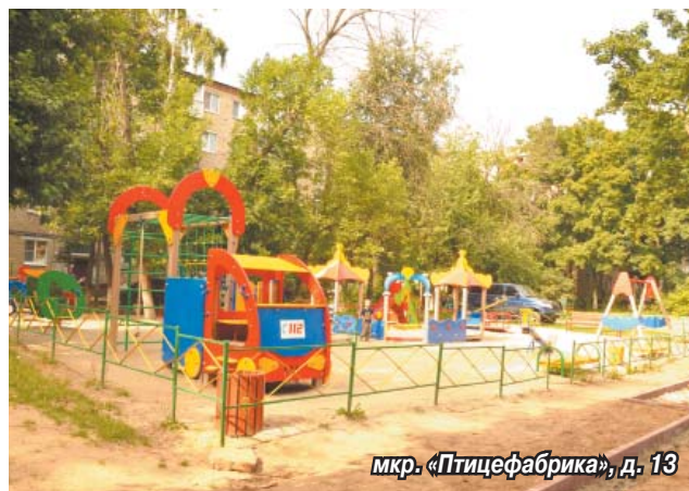
мкр. «Птицефабрика», д. 13

Материалы полосы подготовила Динара ШАТИЛОВА