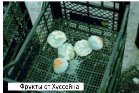
Фрукты от Хуссейна

- ... Не забыл. Не забыл, головой кланусь! Пощади, начальник! Холод, фрукты мерзнут, быстрее продать надо... Штраф платить – заплачу. Но только не прогоняйте!