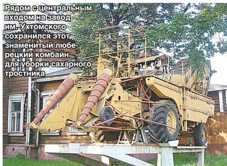
Рядом с центральным входом на завод им. Ухтомского сохранился этот знаменитый люберецкий комбайн для уборки сахарного тростника

братской могиле, где уже лежали Ухтомский и его боевые соратники. А 1 мая 1918 года на месте захоронения был воздвигнут памятник на средства, собранные народом.