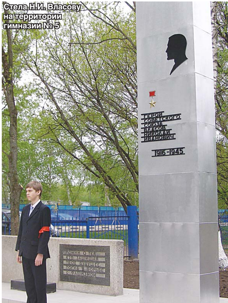
Стела Н.И. Власову на территории гимназии №5

население Люберец, и 17 августа 1925 года село получило статус города. В 1934 году в состав города вошли Панки, Подосинки и дачный посёлок Михельсон. В 1939 году в Люберцах проживало уже 46,5 тысяч человек.