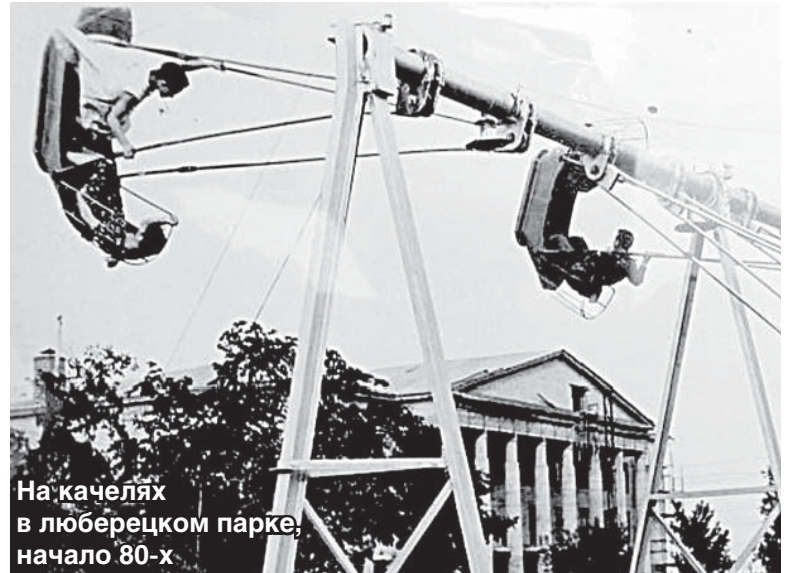
На качелях в люберецком парке, начало 80-х

Центральный парк культуры и отдыха г. Люберцы (8%) Начало XVIII века. Период правления императора Петра I Велико-