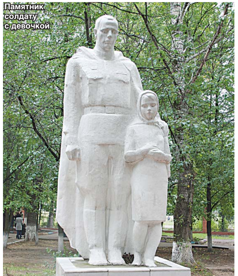
Памятник солдату с девочкой

За восемь лет существования Дворца спорта, в нём прошла не одна сотня районных, ▶