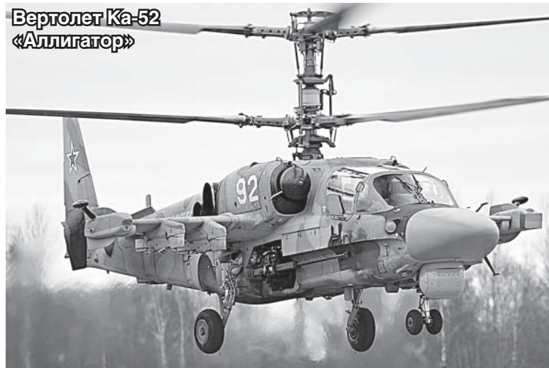
Вертолет Ка-52 «Аллигатор»

Знаменитый Ухтомский вертолетный завод в субботу в 65-й раз отмечал свой день рождения. В канун праздника было распространено множество приглашений, но, к сожалению, из-за проливного дождя не все они были использованы. И все же, многие рискнули прийти в дождливый субботний вечер на стадион «Торпедо», а некоторые вообще гуляли с 11 часов по Городскому парку, где можно было покататься на каруселях или поесть шашлыков. Шли они вместе с горячими напитками в желудки замерзших посетителей с необычайной для своей цены скоростью. И неудивительно, ведь многие, надо полагать, протопали не один километр в этот день, дожидаясь самого главного. В награду камовцы ничего отменять не стали. Организовано все было, с одной стороны, просто, а с другой – зажигательно.