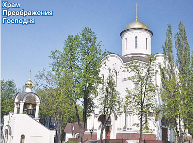
Храм Преображения Господня

Большинство респондентов (22%) справедливо считают, что символом Люберец является мемориал «Вечный огонь». Его история начинается с 1965 года, когда здесь, на пересечении Октябрьского проспекта и улицы Власова, была воздвигнута стела Герою Советского Союза Николаю Власову. Около неё был зажжён Вечный огонь. В течение многих лет к мемориальному комплексу возлагали цветы молодожёны, фронтовики склоняли головы перед памятью друзей-однополчан, которые остались на полях сражений и не дожили до сегодняшних дней.