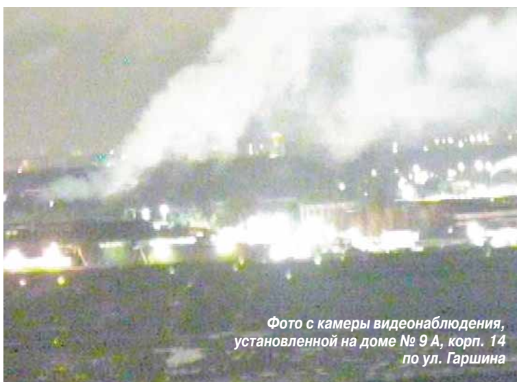
Фото с камеры видеонаблюдения, установленной на доме № 9 А, корп. 14 по ул. Гаршина

Администрация Томилино подводит итоги конкурса «Лучший дворик». Из шести дворовых территорий, жильцы которых заявили о своем желании участвовать в конкурсе, три будут удостоены права называться «Территория образцового содержания». А все сторонники создания красоты и поддержания чистоты на территории своего проживания будут удостоены благодарности от администрации поселка и специальных наград.