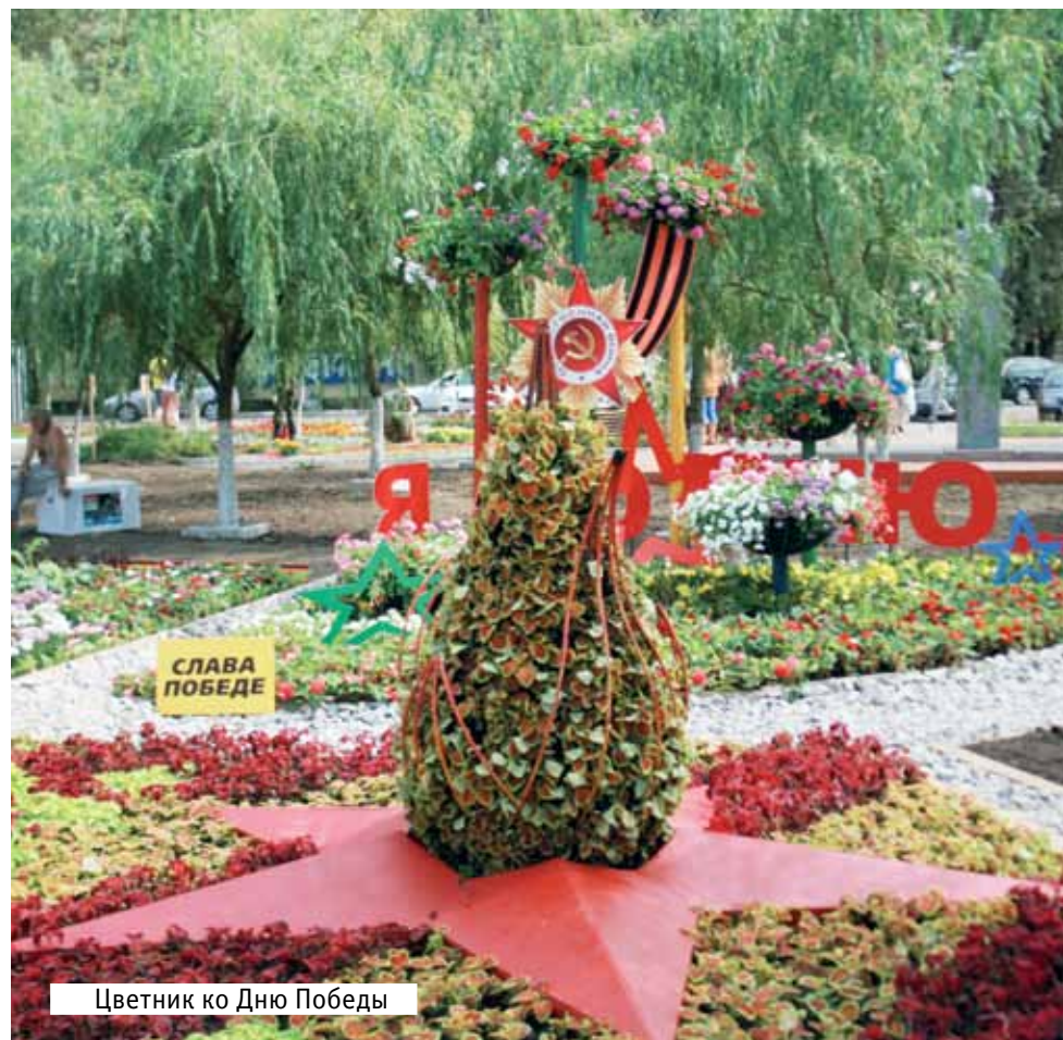
Цветник ко Дню Победы

5. С 1 января 2011 года начнут работать еще 2 детских сада: новый детский сад на территории микрорайонов 7-8 и детский сад в поселке ВУГИ, здание которого принято из федеральной собственности.