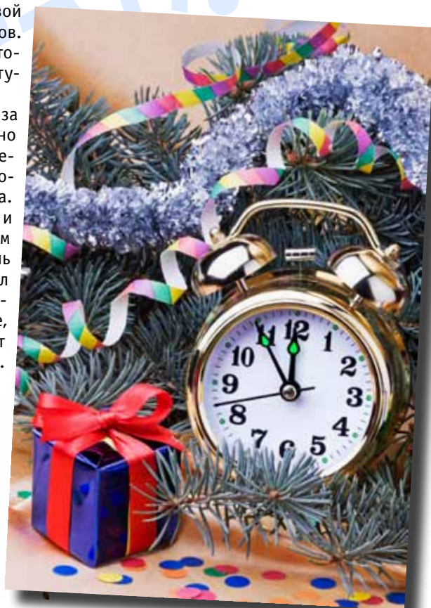
Калейдоскоп подготовили Ирина Илюхина и Ксения Полякова

Приблизьте свой праздничный внешний вид, состояние квартиры и новогодний стол к образу жизни Кролика и Кота - и ваша жизнь в будущем году станет такой же пушистой, удачливой, уютной, полной дружбы и любви.