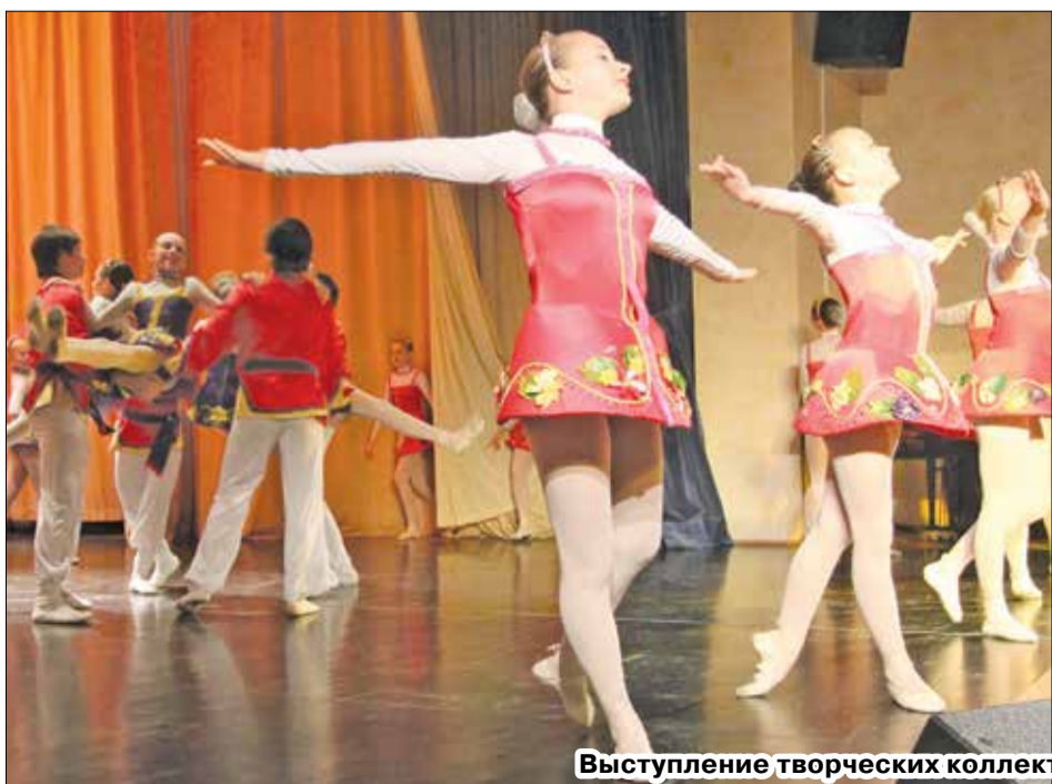
Выступление творческих коллективов Красковского культурного центра