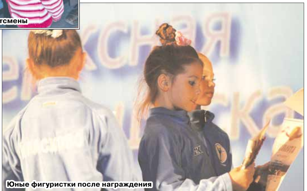
Юные фигуристки после награждения

Сейчас в школе трудятся 26 человек, в семи отделениях по видам спорта (футбол, волейбол, шашки го, фигурное катание на коньках, лыжные гонки, каратэ-до и тазквондо) обучаются около шестисот воспитанников.