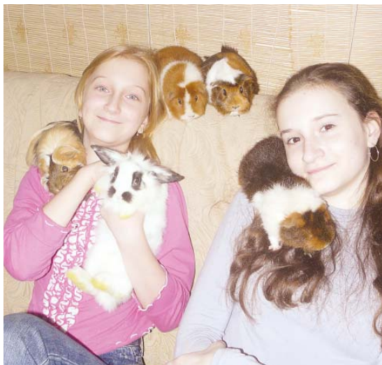
Окончание. Начало на 1-й стр.

– Количество детей – это семейная традиция? Предполагалось, что будет именно двое?