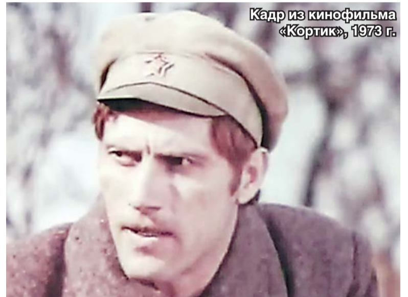
Кадр из кинофильма «Кортик», 1973 г.

– Да, мы дружили. И когда Серёжа находился в заключении, я несколько раз его навещал (тогда С.И. Параджанов был уже переведён