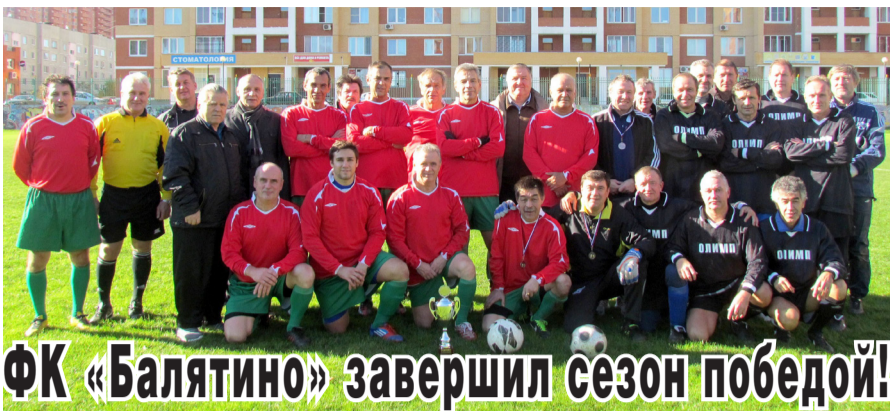
ФК «Балытино» завершил сезон победой!

12 октября на стадионе «Балытино» состоялось закрытие футбольного сезона. Перед игрой команде ветеранов вручили кубок и грамоты за третье место, занятое в первенстве Люберецкого района.