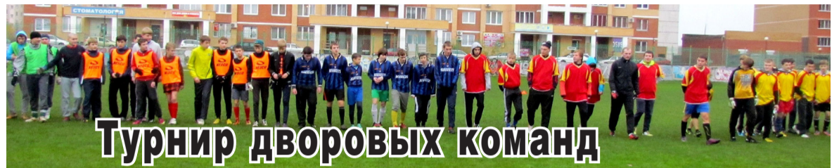
Турнир дворовых команд

19 октября на стадионе «Балытино» состоялся турнир дворовых команд.