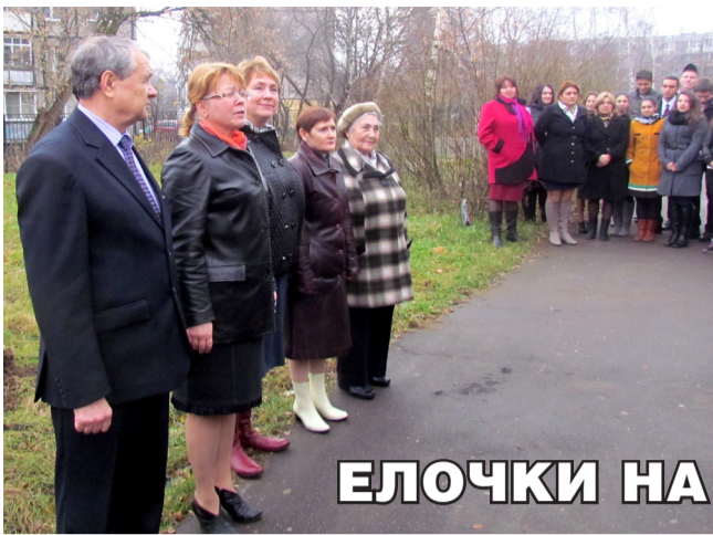
ЕЛОЧКИ НА ШКОЛЬНОМ ДВОРЕ