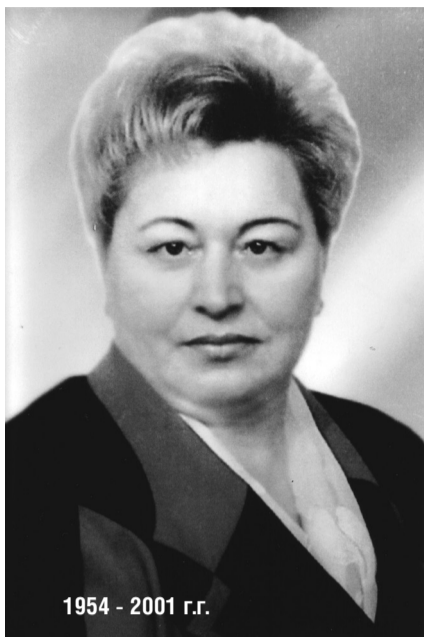
1954 - 2001 г.г.