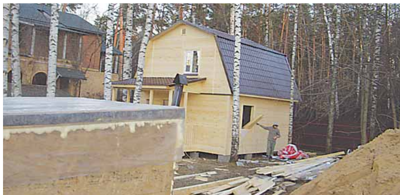
Вот и дом готов вместо леса, изрядно прореженного арендаторами-лесорубами

Схема дала отличные результаты не только в Томилино, но и в Красково, Малаховке. Делалось это так. Вместо части парка и аллеи, по которой люди привыкли ходить в лес, сперва появился забор, потом бытовка, а теперь уже и дом. Все старания местных жителей, томилинских депутатов, запросы Томили-