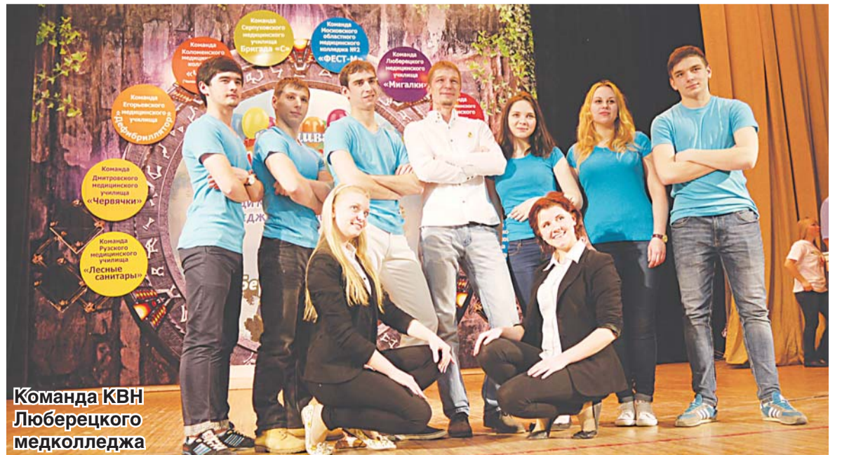
Команда КВН Люберецкого медколледжа

Давно поутихли традиционные КВНовские страсти болельщиков, отзывались фанфары в честь луч-