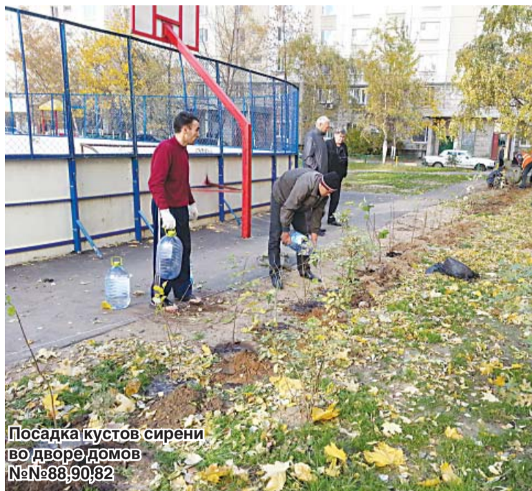
Посадка кустов сирени во дворе домов №№88,90,82

осины, сливы. У домов № 94-96 – 26 молодых липок, у домов №№ 82, 86, 88 и 90 – 30 липок и еще 50 кустов сирени, у домов №№ 78, 80, 84 – 20 кленов, у домов №№ 72 и 78 – 200 саженцев цветущего кустарника спиреи, у дома № 62 – 40 рябин.