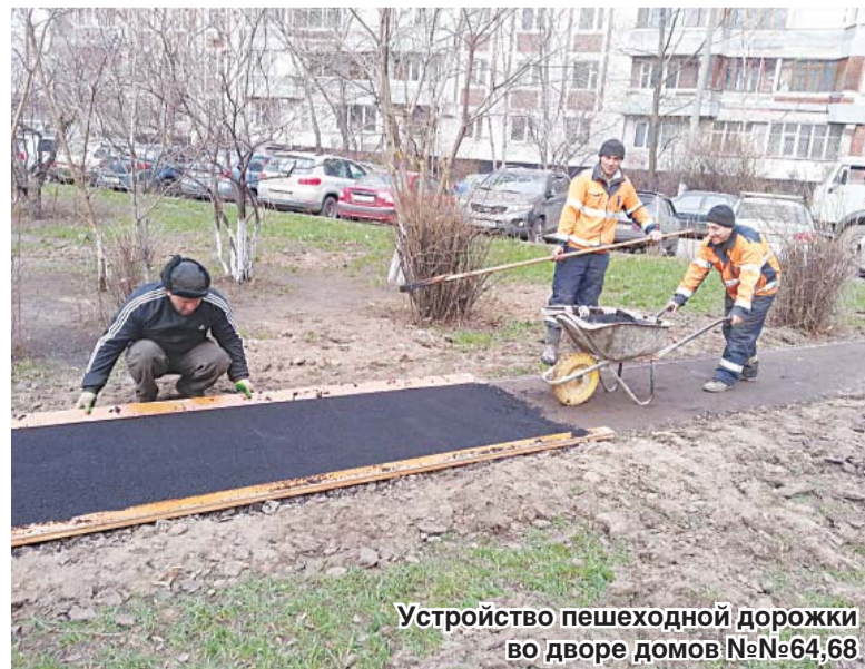
Устройство пешеходной дорожки во дворе домов №№64,68

– И еще – дорожный знак, ограничивающий скорость. По договоренности с ОГИБДД было выполнено пожелание избирателей сделать этот проезд более безопасным, а то там такие гонки были, особенно по вечерам! На въезде в гарнизон со стороны улицы маршала Полубоярова, между домами № 90 и 92, силами компании «ЭЛЭК» по моей просьбе поставлены опоры улич-