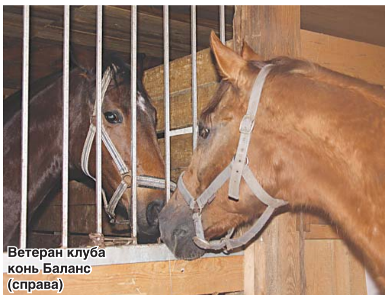
Ветеран клуба конь Баланс (справа)

Наш Буржуй снимался в сериалах «Гром» и «Уйти, чтобы вернуться». Он же недавно участвовал в новогодней передаче «Поле чудес». Ротора мы возили