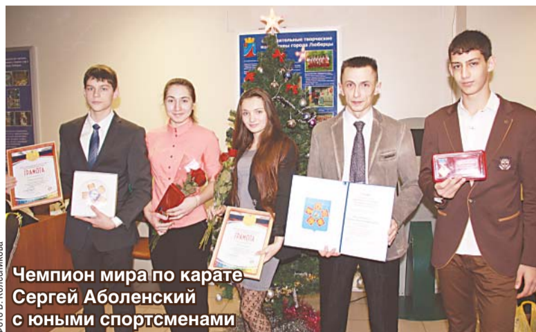
Чемпион мира по карате Сергей Аболенский с юными спортсменами

Сборные команды и отдельные спортсмены в различных видах спорта достойно защищают честь