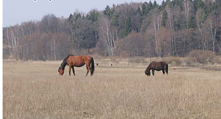
Поле близ деревни Мотяково.

«Пятая ступенька», «Сильное звено», «Современники».