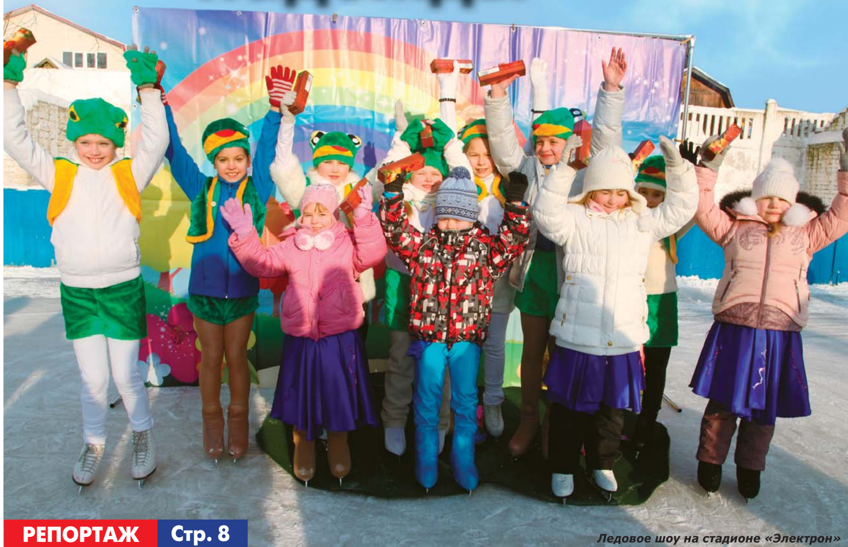
Ледовое шоу на стадионе «Электрон»