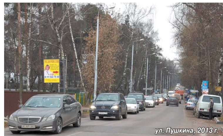
ул. Пушкина, 2013 г.