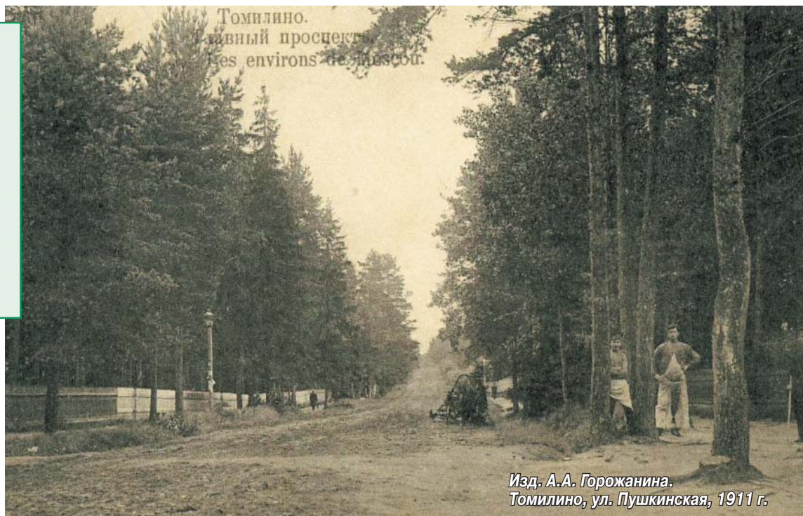
Изд. А.А. Горожанина. Томилино, ул. Пушкинская, 1911 г.

Словом, от всех, кто любит Томилино и хочет внести свой вклад в историческую летопись поселка, мы ждем воспоминаний о замечательных предках и их жизни, о родовых старинных дачах и их домочадцах. Нам всем будут интересны истории, о которых, возможно, напоминают пожелтевшие от времени фотографии в семейных альбомах, вырезки из газет, уникальные свидетельства людей старшего поколения. Мы надеемся, что сообщая мы сможем открыть много нового в истории своей малой Родины и узнать имена людей, которыми должны гордиться. Если вам есть чем поделиться с земляками, напишите или позвоните в редакцию газеты «Томилинская Новь».