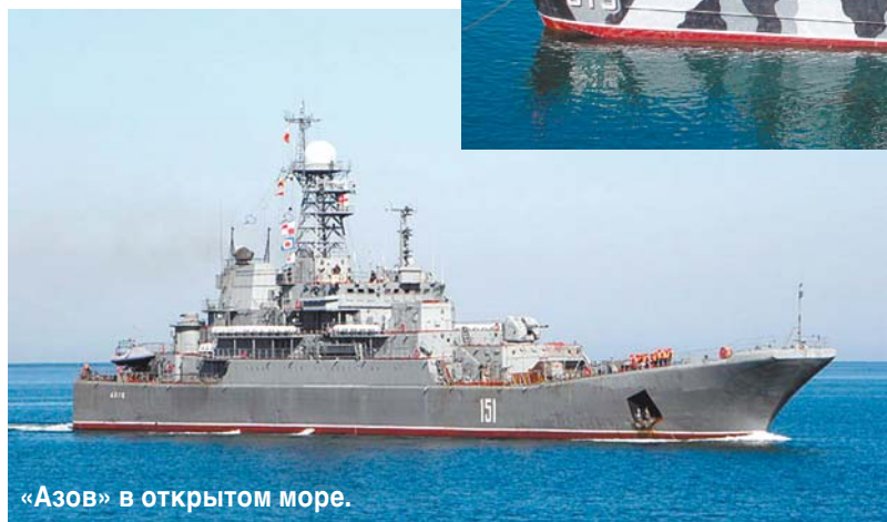
«Азов» в открытом море.