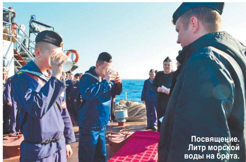
Посвящение. Литр морской воды на брата.

Вопрос: — В России срочная воинская служба становится все короче. В середине XIX века в солдаты уходили на 25 лет. В начале XX века — на 7. При Советской власти служили 2 года в сухопутных войсках и 3 — в море. А сегодня вне зависимости от рода войск призывают всего на год. Можно ли за это время реально научиться Родину защищать?