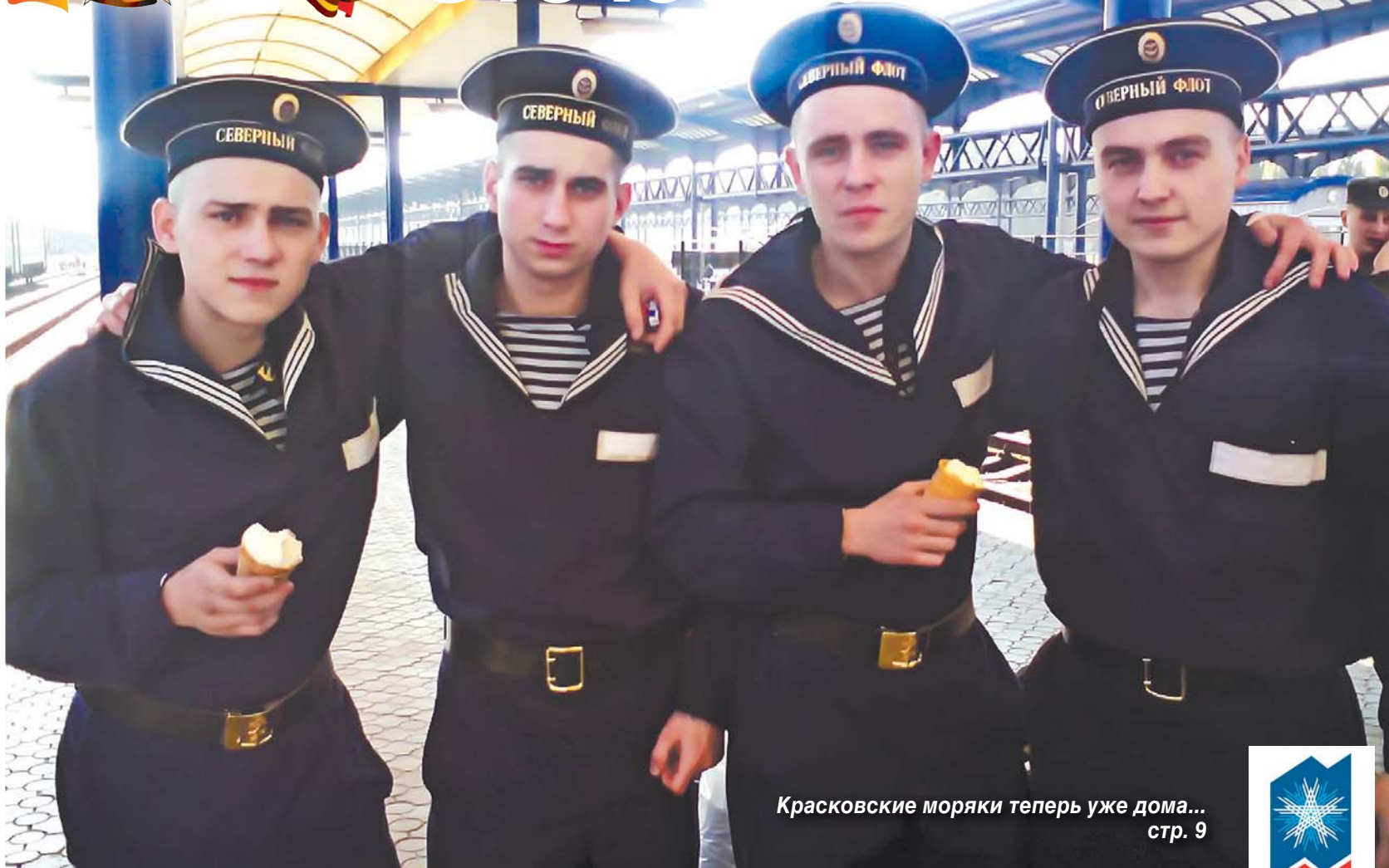
Красковские моряки теперь уже дома... стр. 9