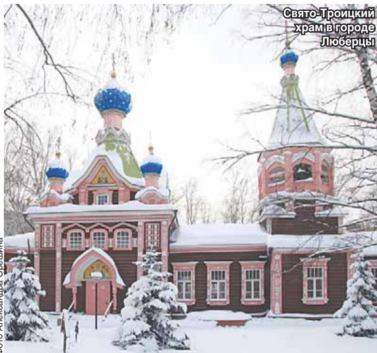
Свято-Троицкий храм в городе Люберцы