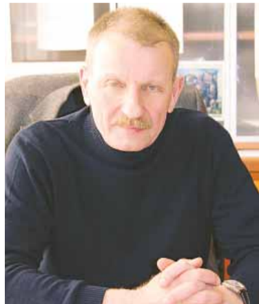
Окончание. Начало на 1-й стр.

— Сергей Сергеевич, летом 2011 года в Лондон спецгрузом была доставлена точная копия памятника Юрию Гагарину, установленного в 1984 году около училища на Октябрьском проспекте в Люберцах, в стенах которого с 1949 по 1951 годы будущий первопроходец космоса обучался по специальности формовщика-литейщика. Отправился бронзовый памятник в туманный Альбион неслучайно — в июне 2011 года исполнилось 50 лет, как Юрий Гагарин посетил Англию. На ряду с этим знаковым событием, в Лондоне проходила тематическая выставка, посвящённая жизни космонавта № 1. На ней были представлены и катапультное кресло Гагарина, и космический скафандр «СК-1».