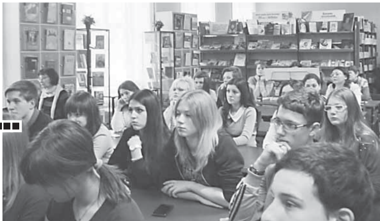
В Кабул летят вчерашние мальчишки...