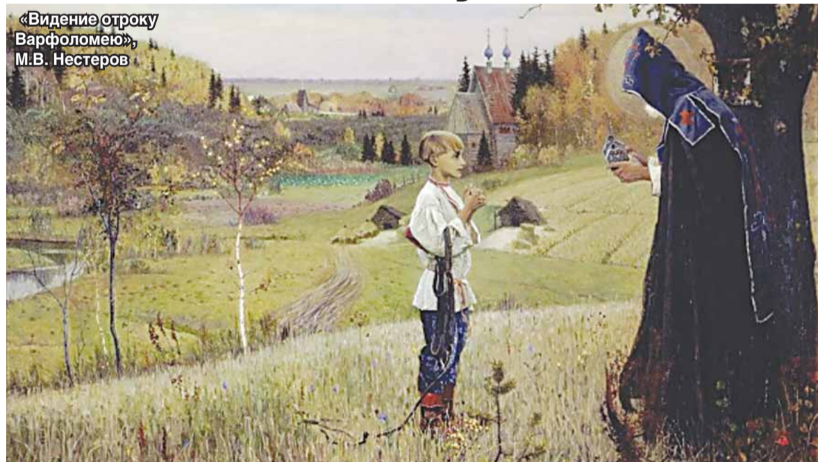
«Видение отроку Варфоломею», М.В. Нестеров

Открытый урок, посвященный 700-летию со дня рождения преподобного Сергия, игумена и чудотворца Радонежского, основателя Троице-Сергиевой лавры, прошел 25 февраля в большом зале люберецкого лицея № 12.