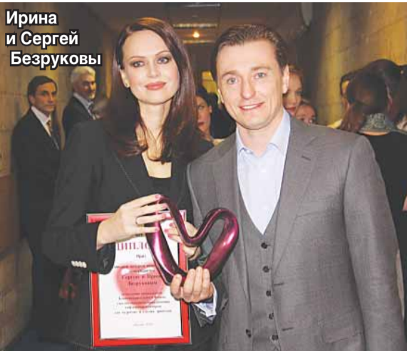
Ирина и Сергей Безруковы

Юбилейный вечер, посвящённый 25-летию со дня основания Гильдии актёров кино России прошёл 20 февраля в Большом зале столичного Дома кино Союза кинематографистов Российской Федерации.