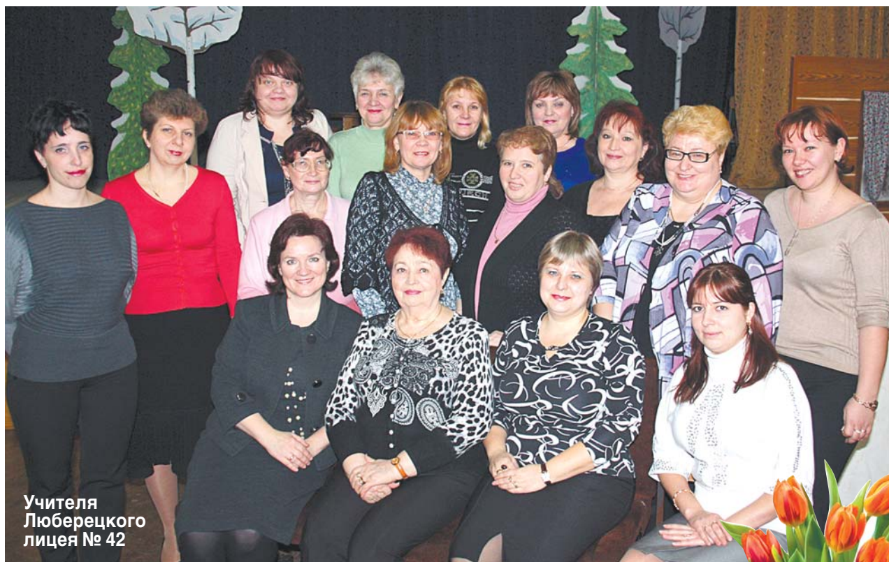
Учителя Люберецкого лицея № 42