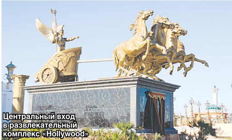
Центральный вход в развлекательный комплекс «Hollywood»

Исторически так сложилось, что многие русские туристы, имеющие загранпаспорт, свой отпуск предпочитают проводить под жарким солнцем Египта. Во-первых, это Красное море, песчаные пляжи и прибрежные отели. Во-вторых, температура воды в море не опускается ниже +20°C даже зимой. Дожди здесь чрезвычайно редки, а воздух сухой и тёплый в любое время года. В-третьих, относительно других тёплых стран, отдых в Египте обходится намного экономней.