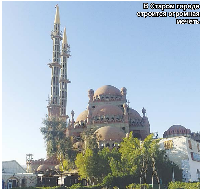
В Старом городе строится огромная мечеть