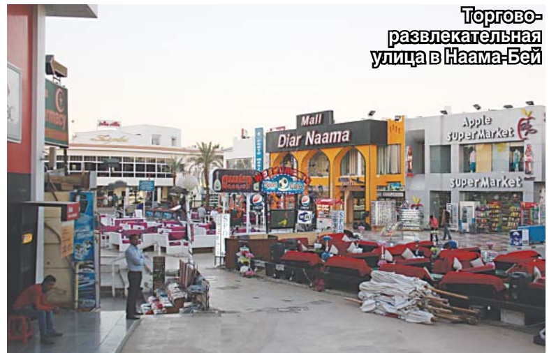
Торгово-развлекательная улица в Наама-Бей