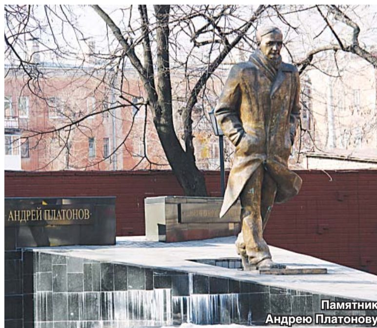
Памятник Андрею Платонову

рая состоялась в сентябре 1998 года, Троепольский не дождался.