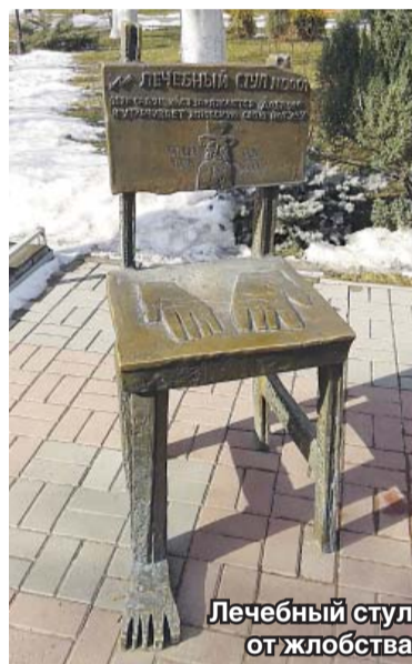
Лечебный стул от жлобства

А годом раньше перед собором был открыт памятник святителю Митрофану, мощи которого помещены в раку, сделанную из ураль-