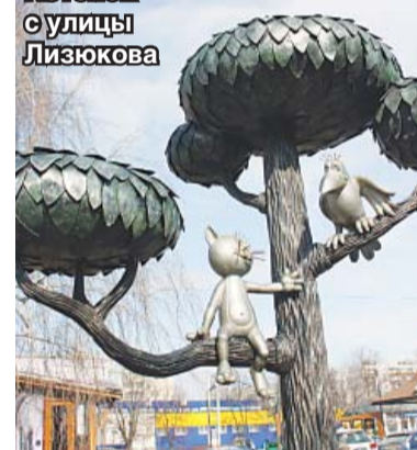
Котёнок с улицы Лизюкова

щались первые корабли русского флота. Сам Пётр I своим Указом объявил этот храм главным собором Адмиралтейства.