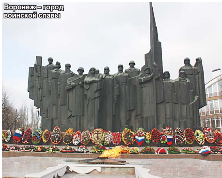
Воронеж – город воинской славы

Благовещенский собор. Его строительство велось на народные деньги с конца 1990-х гг., значительную лепту внесли и предприятия области. Благодаря активной поддержке властей и многочисленным пожертвованиям, он был возведён довольно быстро, и уже в 2004 году здесь начались регулярные богослужения.