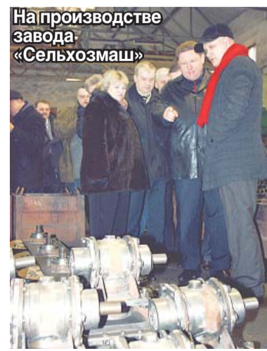
На производстве завода «Сельхозмаш»