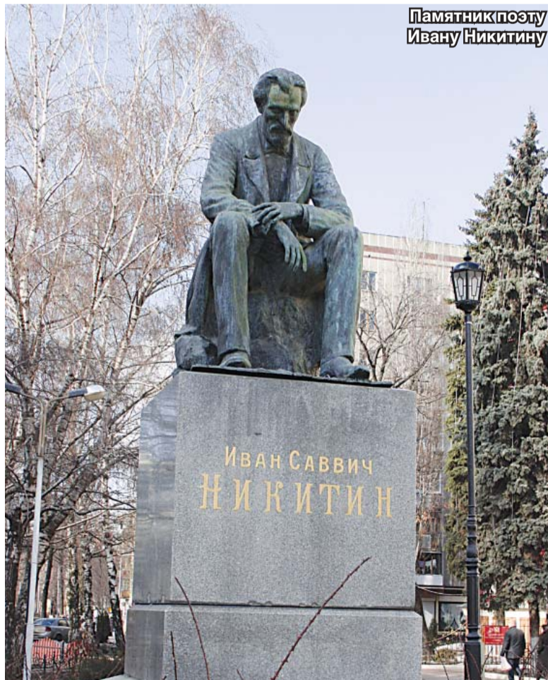
Памятник поэту Ивану Никитину