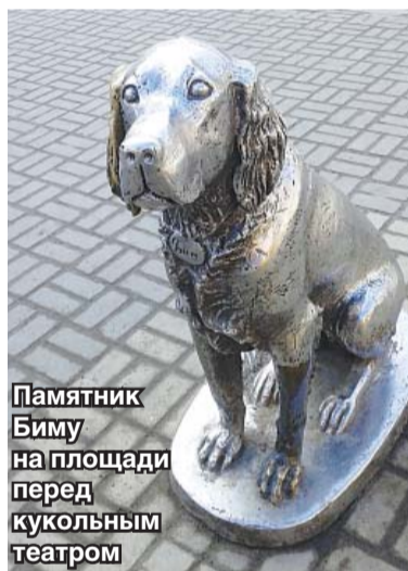
Памятник Биму на площади перед кукольным театром

Так, например, никого не оставит равнодушным памятник Котёнку с улицы Лизюкова – герою одноимённого мультфильма. Лицезреть этот шедевр современной скульптуры можно прямо у