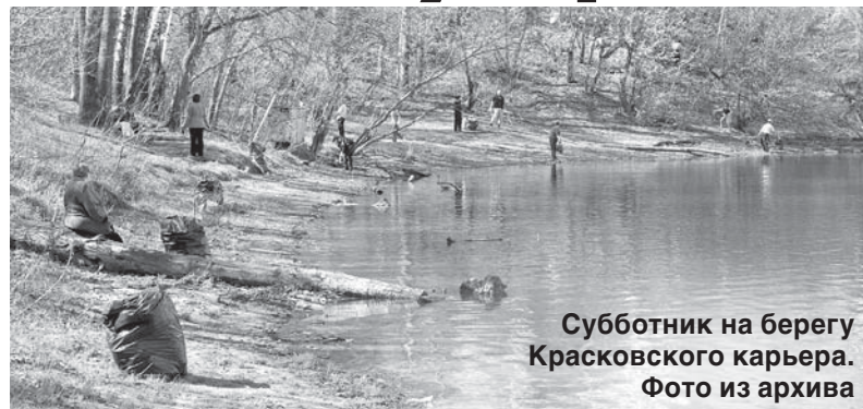
Субботник на берегу Красковского карьера.

комиссионный выезд территорий муниципальных образований, определены лучшие и худшие муниципалитеты – рейтинги будут представлены общественности.