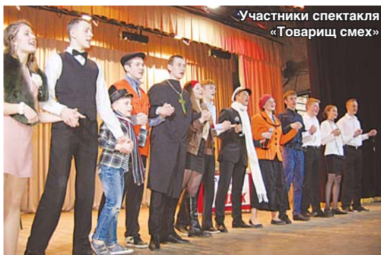
Участники спектакля «Товарищ смех»