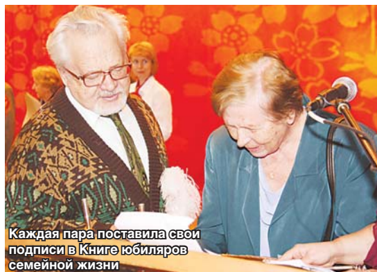
Каждая пара поставила свои подписи в Книге юбиляров семейной жизни

Желаем вам, дорогие юбиляры, крепкого здоровья, счастья, бодрости духа и чистого неба над головой!