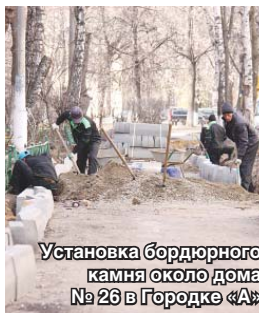
Установка бордюрного камня около дома № 26 в Городке «А»

— Впереди нас ждёт большая реконструкция Октябрьского проспекта со строительством здесь нескольких подземных переходов: убрав «лишние» светофоры, мы улучшим дорожное движение на главной магистрали города, — сообщил градоначальник. — Когда завершится реконструкция Новорязанского шоссе в районе Жулебина, весь большегрузный транспорт, минуя центр Люберец, будет следовать по трассе М5 «Урал»: согласно решению областного правительства движение грузового транспорта по Октябрьскому проспекту запрещено.