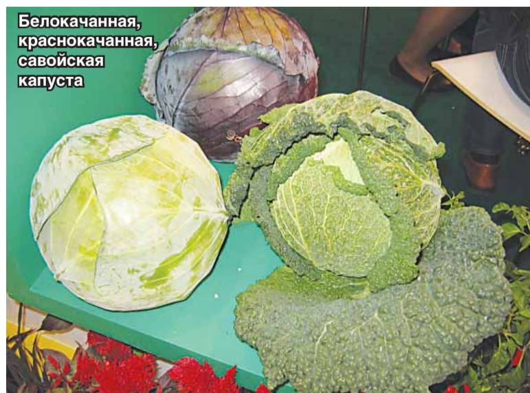
Белокачанная, краснокочанная, савойская капуста

Сегодня речь пойдет о тех видах капусты, выращивание которых возможно и перспективно и