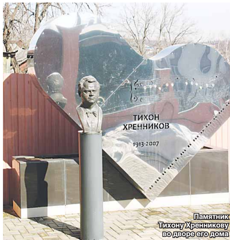
Памятник Тихону Хренникову во дворе его дома

Церковь возведена по инициативе Елецкого общества хоругвеносцев. Торжественная закладка храма состоялась 15 ноября 1909 года, завершились работы к началу февраля 1911 года. При постройке использовались технические новинки своего времени, такие как бетонные перекрытия, электричество, автоматически убираемые сидения, водопровод, водяное отопление. Освящён