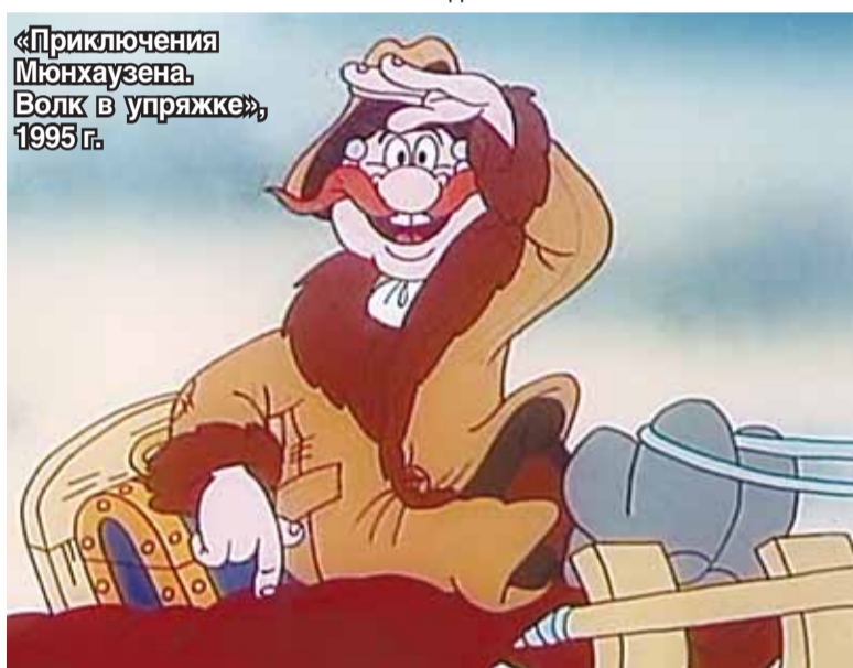
«Приключения Мюнхаузена. Волк в упряжке», 1995 г.

— Последние лет двадцать вы ничего не снимаете. Решили поставить на этом точку?