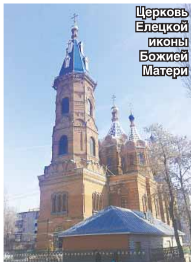
Церковь Елецкой иконы Божией Матери

Закладка храма состоялась в 1893 году в преддверии 500-летнего юбилея явления в Ельце Богородицы во время нашествия Тамерлана. Церковь посвящена чудотворной иконе Елецкой Божией Матери, которая явилась Тамерлану во сне, во главе воинов