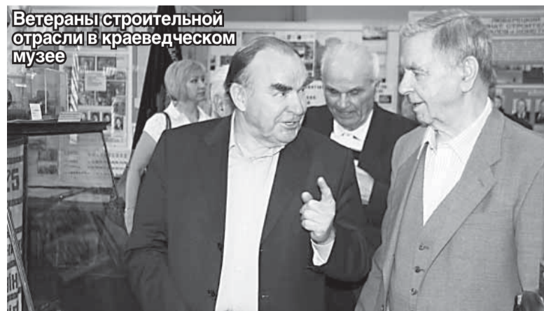
Ветераны строительной отрасли в краеведческом музее

– Значит для района есть более важные объекты строительства.