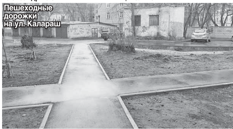
Пешеходные дорожки на ул. Калараш

И это только часть работ, связанных с благоустройством нашего города.