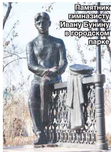
Памятник гимназисту Ивану Бунину в Городском парке

К 2004 году сохранились в сильно разрушенном виде лишь несколько келий, монастырские стены и спуск к святому колодцу. Ни одного храмового здания не уцелело. По решению Священного Синода Русской Православной Церкви 10 лет назад Знаменский женский монастырь вновь был открыт.