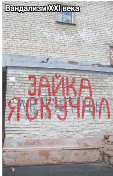
Вандализм XXI века мовых территориях, которые тоже большой заботы требуют.