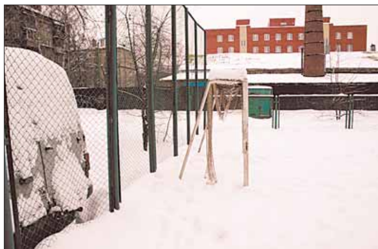
Спортивная площадка на ул. Волковской