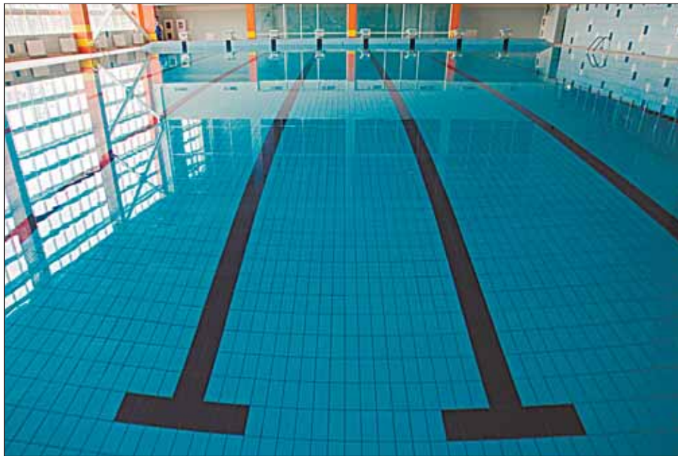
Таким может быть первый в Люберцах бассейн

Уверен, что жители Люберец и без меня знают о неоспоримой пользе плавания. Иначе они не задавались бы уже прозвучавшим в начале статьи вопросом и не искали бы альтернативные варианты. Сегодня им приходится посещать бассейны в Москве и соседних населенных пунктах. Из наиболее доступных вариантов: спортивный комплекс «Дружба» в Котельниках, бассейн «Дельфин» в Некрасовке и клуб «Цитрус» в Томилине. В столице жители Люберец предпочитают «Косино», а также «Нептун» и «Парус» в Жулебине, «Альбатрос» в Кожухове. Все перечисленные бассейны имеют длину 25 метров, глубину до 2,5 метра и оснащены, в среднем, 5-6 дорожками.