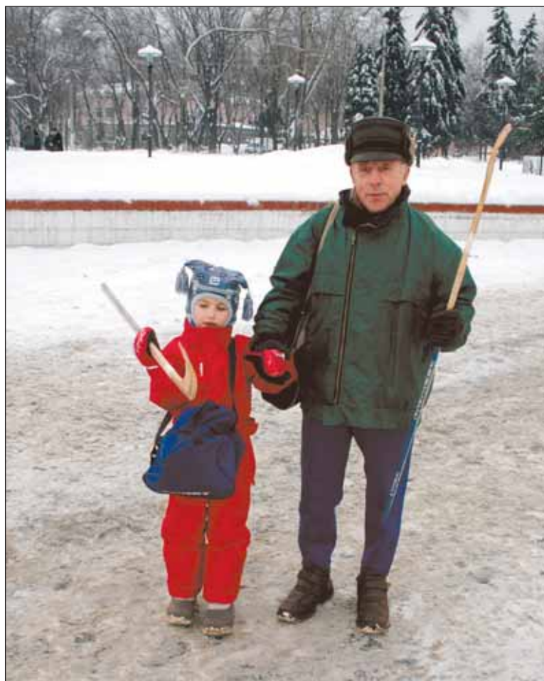
Хотим сыграть в хоккей

– Живу в соседнем доме. Вот, хожу, присматриваюсь: нельзя ли тут дело по-умному поставить? Я бы мог, например, взять в аренду часть территории. Клочок берега и участок самого пруда. Расчистил бы все, лед отшлифовал – сейчас есть такая техника. Павильончик бы на берегу пристроил – переобуваться. Перевез бы туда на время свое точило для коньков. И стои-