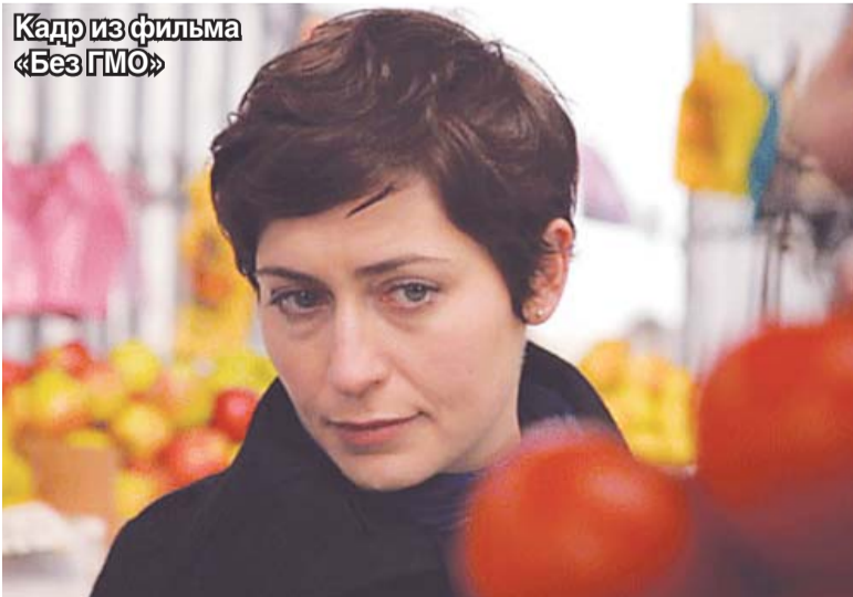
Кадр из фильма «Без ГМО»

А сейчас мы продолжаем работать над проектом полнометражного игрового кино «Панда». Это комедия о молодом человеке, которого зовут Паша, он живёт в Харькове, работает в школе учителем физкультуры. Парень придумал новый вид борьбы — кунг-фу Панда, и некоторые ученики стали посещать его занятия. Но в один прекрасный день директор школы ему сообщает, что поскольку на его занятия ходит слишком мало детей, она вынуждена закрыть его секцию и отдать это помещение для занятий шейпингом, что принесёт учреждению хоть какие-то деньги, которые можно будет направить на ремонт школы. Она даёт Паше неделю, чтобы тот сделал свою секцию посещаемой.