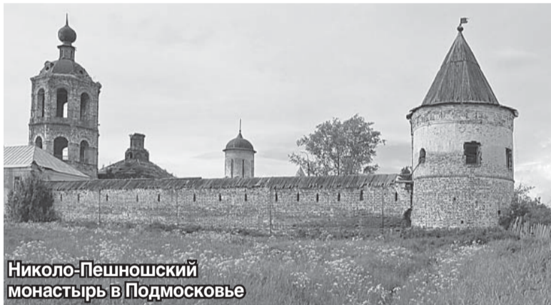
Никола-Пешношский монастырь в Подмосковьё