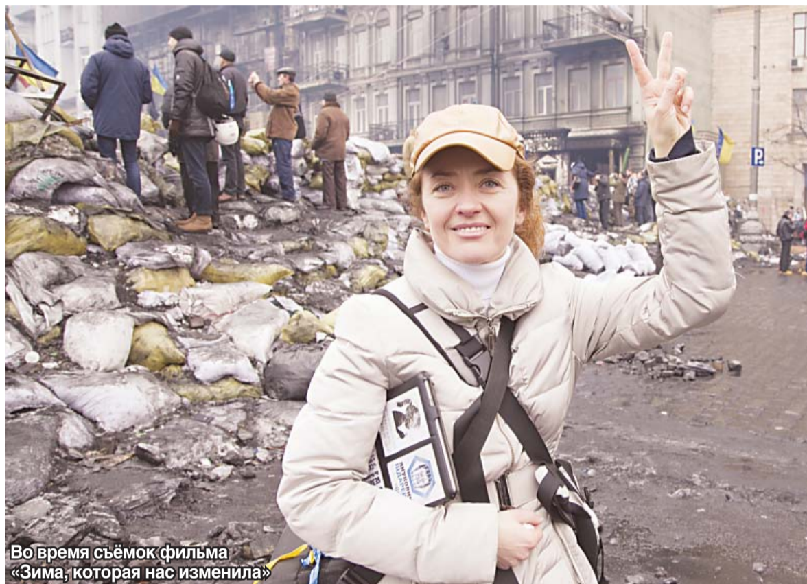
Во время съёмок фильма «Зима, которая нас изменила»