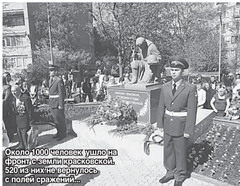
Около 1000 человек ушло на фронт с земли красковской. 520 из них не вернулось с полей сражений...

Богдан КОЛЕСНИКОВ