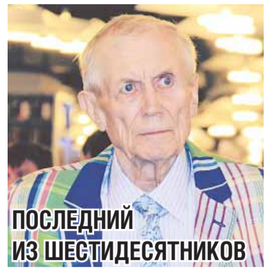
ПОСЛЕДНИЙ ИЗ ШЕСТИДЕСЯТНИКОВ

Яркий пиджак, пёстрый галстук и знаменитый пронзительный взгляд по-прежнему живых, не потухших с годами глаз - в Москву из-за океана прилетел Евгений Евтушенко.