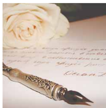
Полосу подготовила Татьяна САВИНА

– Была штыковая атака И радость победы в бою, И было красное знамя, Которое видел Берлин, И каждый твердил: «Я знаю, Что все равно победим!» В победу мы верили свято, Отчизны своей сыны, А помнить, мой внучек, надо, Чтоб не было больше войны!