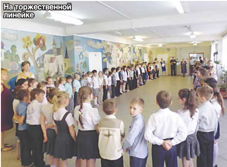
На торжественной линейке