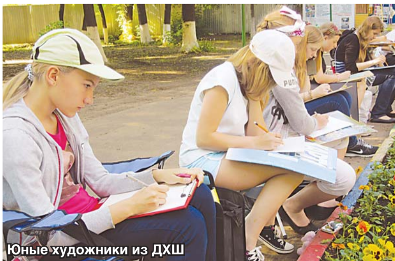
Юные художники из ДХШ

«Пленэр», – произносишь это слово, и в памяти возникают наполненные солнцем и свежим воздухом полотна французских импрессионистов, прекрасные пейзажи русских мастеров живописи: Алексея Саврасова и Василия Поленова, Архипа Куинджи и Аркадия Ры-