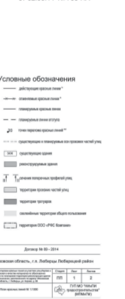
Приложение №2 к постановлению администрации города Люберцы от 02.06.14 № 735-ПА