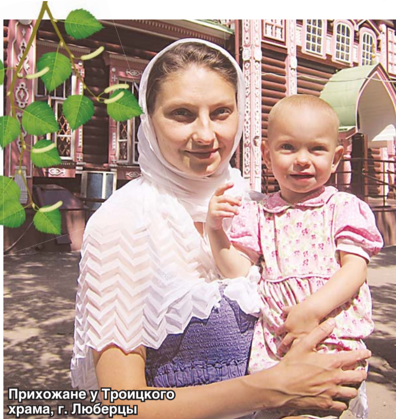
Прихожане у Троицкого храма, г. Люберцы