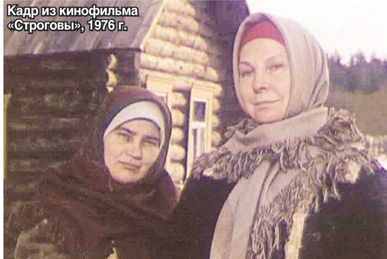
Кадр из кинофильма «Строговы», 1976 г.