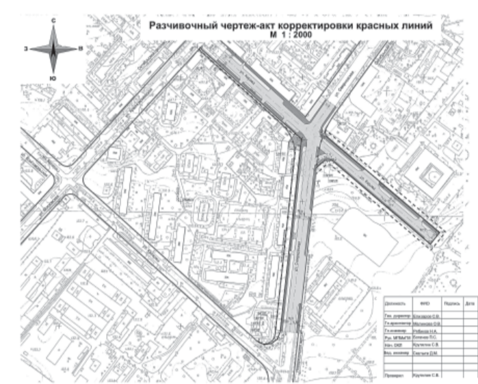
Проект корректировки красных линий на участках улиц Кирова и Смирновская в качестве материалов по обоснованию документации по планировке территории реконструкции здания нежилого назначения, расположенного по адресу: Московская область, г. Люберцы, ул. Кирова, д. 26