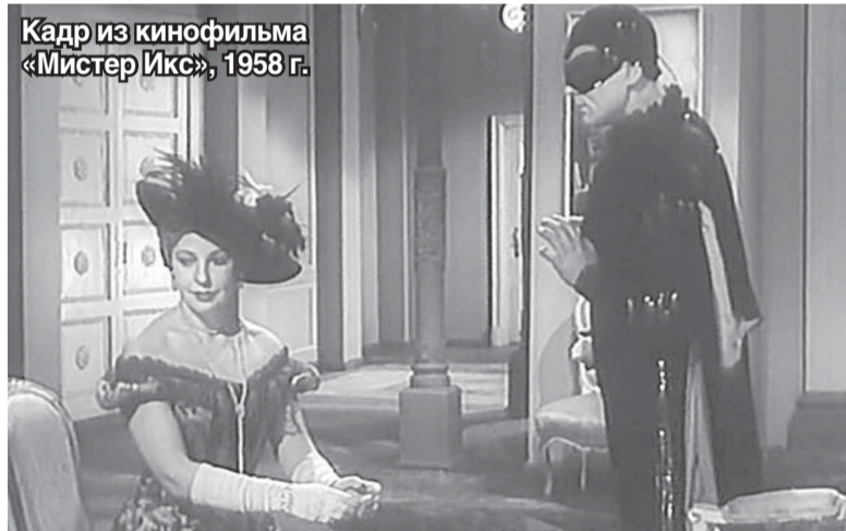
Кадр из кинофильма «Мистер Икс», 1958 г.