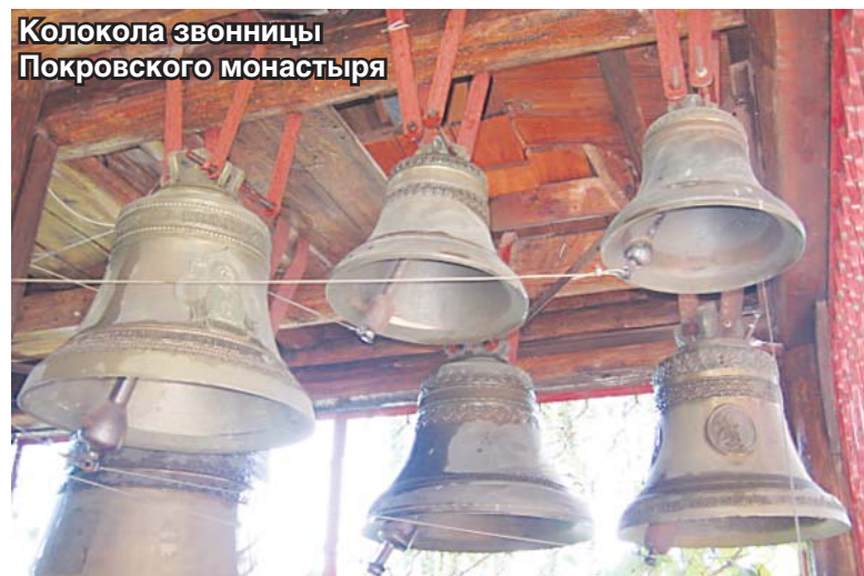
Колокола звонницы Покровского монастыря

Наконец-то и непосвященным стало ясно, что проспект Красной Армии – и есть центральная улица города. Это наглядно подтверждают и заигравшие новыми красками фасады зданий, и тротуарная плитка вдоль всей магистрали, и оживший наконец-то спустя дол-