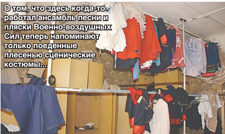
О том, что здесь когда-то работал ансамбль песни и пляски Военно-воздушных Сил теперь напоминают только поеденные плесенью сценические костюмы...

Трёхэтажное здание гарнизонного Дома офицеров общей площадью 7708,6 квадратных метров, наконец, полностью передано министерством обороны в