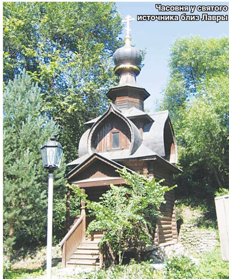
Часовня у святого источника близ Лавры

стям праздника с торжественным словом в честь 700-летия преподобного Сергия Радонежского. В полдень состоится Патриарший прием высоких гостей.