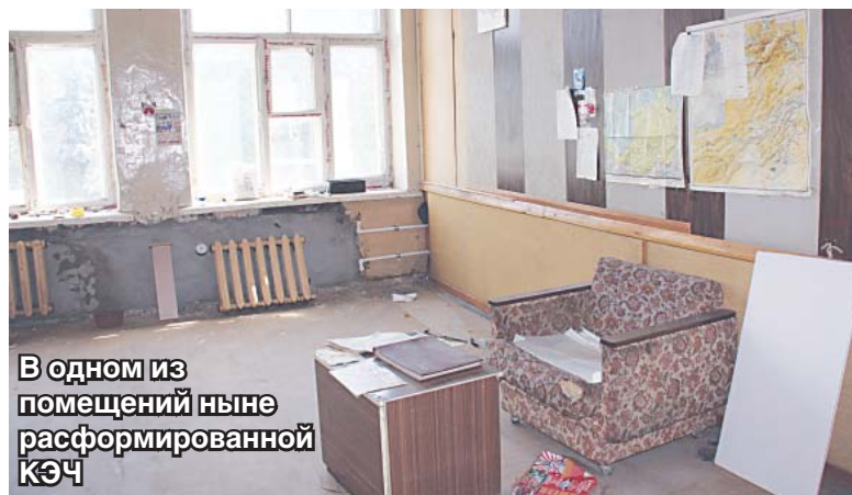
В одном из помещений ныне расформированной КЭЧ

В минувшую среду, 16 июля, коммунальщики тщательно убрали территорию около Дома офицеров. Дворники старательно работали метлами даже на газонах. Тачки с мусором вывозились одна за другой. Это заметили не только мы, но и сотрудники детской музыкальной школы № 4, и просто