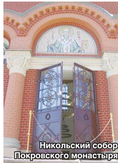
Никольский собор Покровского монастыря

18 июля. В этот день в торжествах в Свято-Троицкой Сергиевой Лавре примут участие делегации от всех Поместных православных церквей. Ожидается приезд на юбилейные торжества Президента РФ В.В. Путина, других первых лиц государства. В 3 часа ночи начнется литургия на Соборной площади Лавры. В 9.00 литургию и молебен преподобному Сергию на Соборной площади совершит Святейший Патриарх Кирилл. В 11.40 Святейший Патриарх Кирилл обратится к пастве и го-