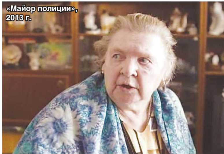
«Майор полиции», 2013 г.

90-х я не застала. Но в то время почти не было никакой работы и на самом «Ленфильме». Тогда, кстати, на многих киностудиях нашей страны снимались не самые лучшие картины. Из-за чего иногда приходилось даже отказываться от предложений. Но я никогда не хотела потерять свою профессию, даже в том случае, когда у меня совсем не было работы. Но наша профессия всё время должна быть в тренинге, поэтому я учила большие отрывки из художественных произведений и с ними выступала.