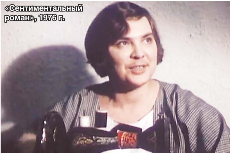
«Сентиментальный роман», 1976 г.