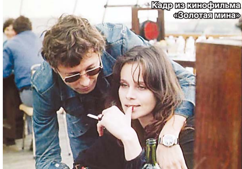
Кадр из кинофильма «Золотая мина»

Богдан КОЛЕСНИКОВ Фото автора и из архива