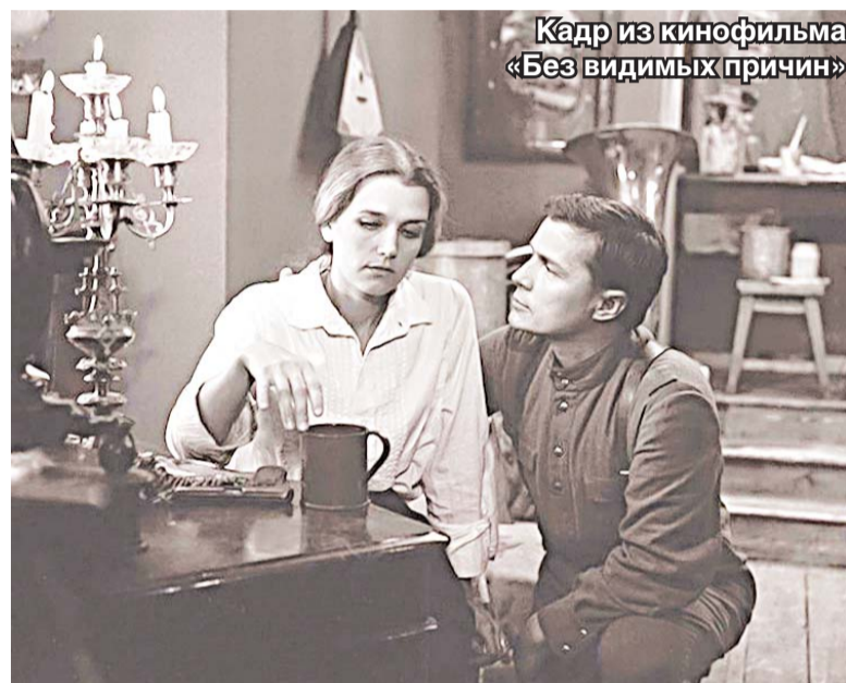
Кадр из кинофильма «Без видимых причин»

кею». «Сначала хоккей с шайбой, а потом начнётся первенство по русскому хоккею?», – подшучивал я. «Не переживайте. Покажем обязательно».