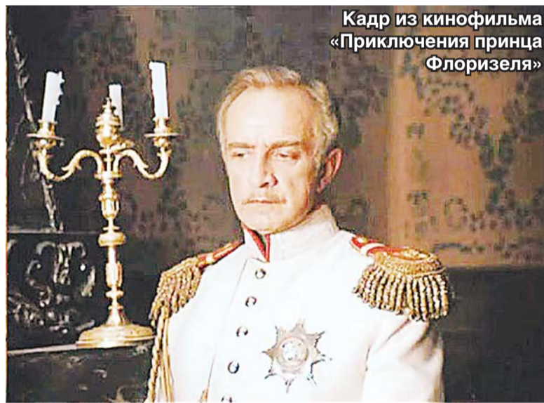
Кадр из кинофильма «Приключения принца Флоризеля»

– Она, увы, так и накрылась незавершённой. Сначала мы столкнулись с проблемой её финан-