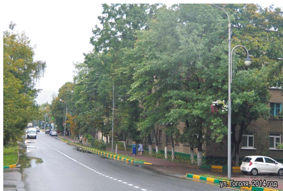
ул. Гоголя, 2014 год

ми, а самой популярной зимней обувью были валенки с калошами.