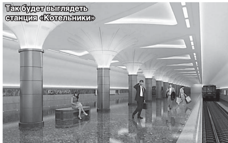
Так будет выглядеть станция «Котельники»