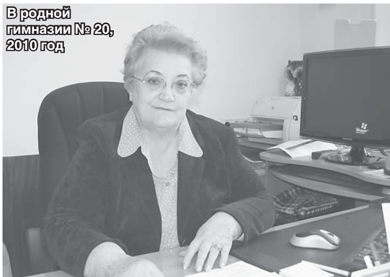
В родной гимназии № 20, 2010 год

ненную ауру, в которой комфортно и мне, и моему окружению.