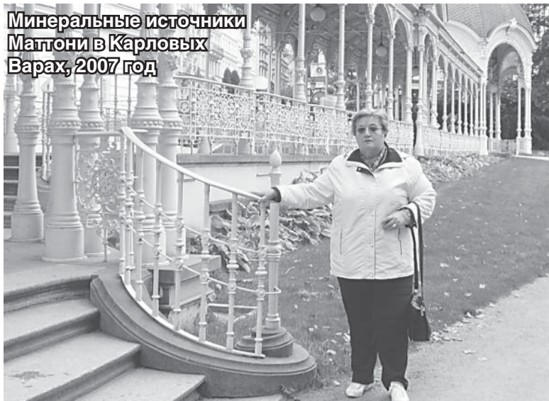
Минеральные источники Матони в Карловых Варах, 2007 год

ню, ездили в Таллинн в поисках комиссара с подводной лодки «Калев» Фёдора Алексеевича Бондарева. И я до сих пор поддерживаю связь с известным