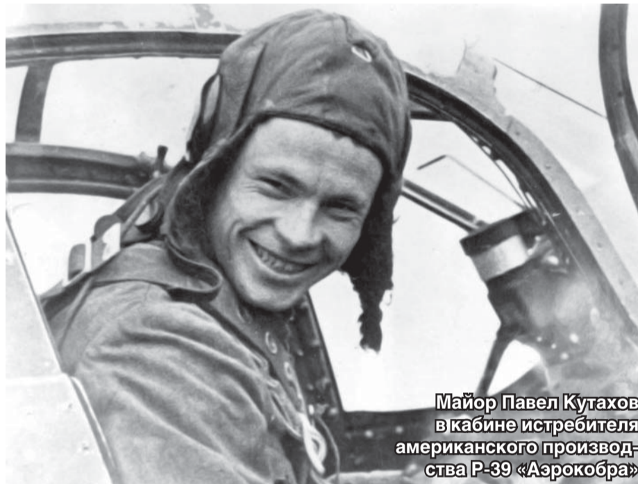
Майор Павел Кутахов в кабине истребителя американского производства P-39 «Аэрокобра»

С 1972 года Павел Степанович – Главный маршал авиации. Огромная и ответственная работа занимала всё его время, всю его жизнь. При нём советские Военно-воздушные силы достигли наибольшей мощи в истории нашего государства. Сильнейшими ВВС они были не только в количественном, но и в качественном отношении – самолётов, подлётных Су-27, МиГ-31, Ту-160, не имела ни одна страна в мире.