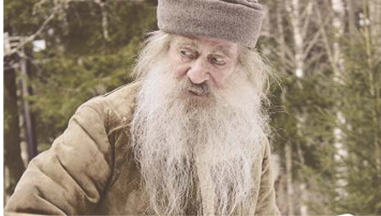
Кадр из кинофильма «Поклонница», 2012 г.