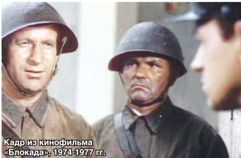
Кадр из кинофильма «Блокада», 1974-1977 гг.

военно-морского института. Ведь я был единственным выпускником этого училища, кто потом «пошёл в артисты». Хотя складывался мой жизненный путь непросто. С 1946 по 1953 годы я был воспитанником сначала подготовительных курсов с программой Нахимовского училища, а затем – Балтийского высшего военно-морского училища, принял присягу, и позже был назначен командиром десантного корабля Дунайской речной флотилии. Честно говоря, хотел учиться в Нахимовском, но в него поступить не удалось, потому что тогда туда принимали детей погибших моряков. А мой отчим, который во время войны был техником на аэродроме, думал меня определить в авиационное училище, но медкомиссия выявила, что мой вестибулярный аппарат никуда не годится. Странно, что этого тогда не учли моряки, ведь качка на корабле тоже, дай Бог, как испытывает «вестибулярку». (Смеётся).