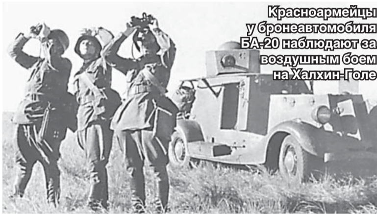
Красноармейцы у броневомобиля БА-20 наблюдают за воздушным боем на Халхин-Голе

Майор просыпается от ожога – он прижался щекой к броне, – шестьдесят градусов Цельсия. В небе несколько точек. Это орлы ушли вверх от жары. В броневом зеленом стекле через цепи низких барханов, переваливаясь, как утки, под абсолютно красным солнцем, по абсолютно желтой земле абсолютно черные танки идут уже третьи сутки. Все цвета давно исчезли. Остались только три: желтое... красное... черное... – цвет жары, цвет крови, цвет стали.