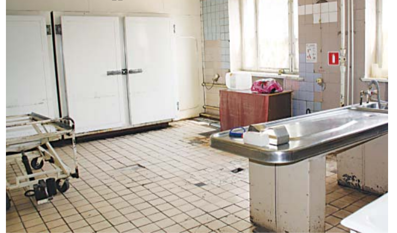
В секционном зале патологоанатомического отделения ЛРБ № 2

невозможно было сделать ни гастроскопию, ни отвезти на компьютерное исследование. Объективной причиной считается и атипичность течения заболеваний, характерная для больных сахарным диабетом: все заболевания у них протекают не так,