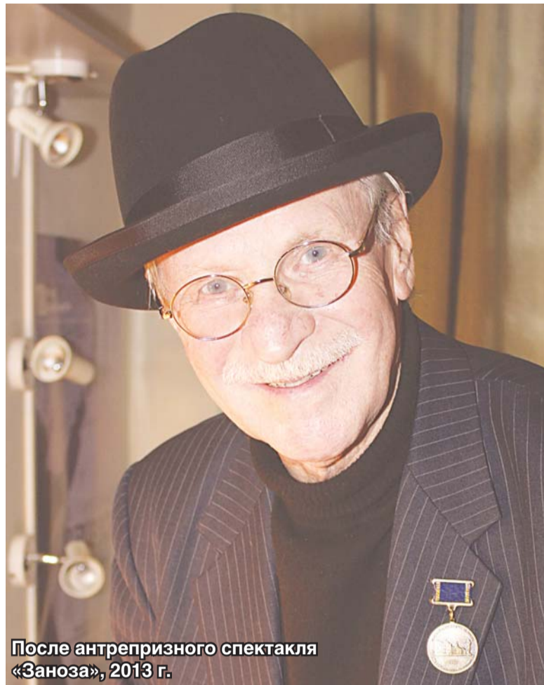
После антрепризного спектакля «Заноза», 2013 г.

Помню, в конце 80-х годов, когда Рубен Сергеевич уже неважно себя чувствовал, в нашем театре прошла его творческая встреча, во время которой из зала пришла записка следующего содержания: «Рубен Сергеевич, вы думаете, что в Ленинграде не знают о вашем конфликте с Краско? Расскажите, в чём же дело?». А вся труппа тогда сидела на сцене. «Иван,