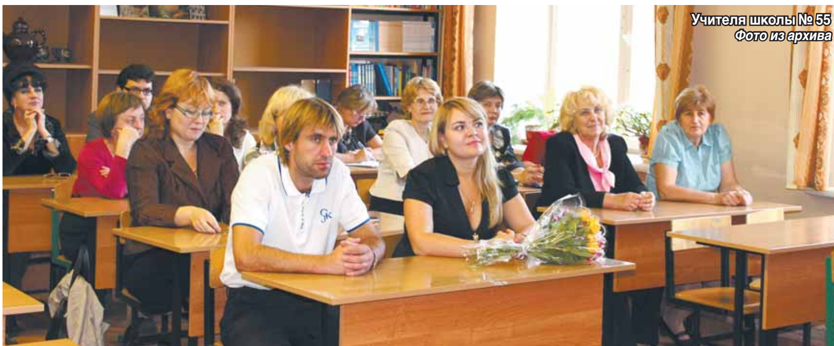
Учителя школы № 55