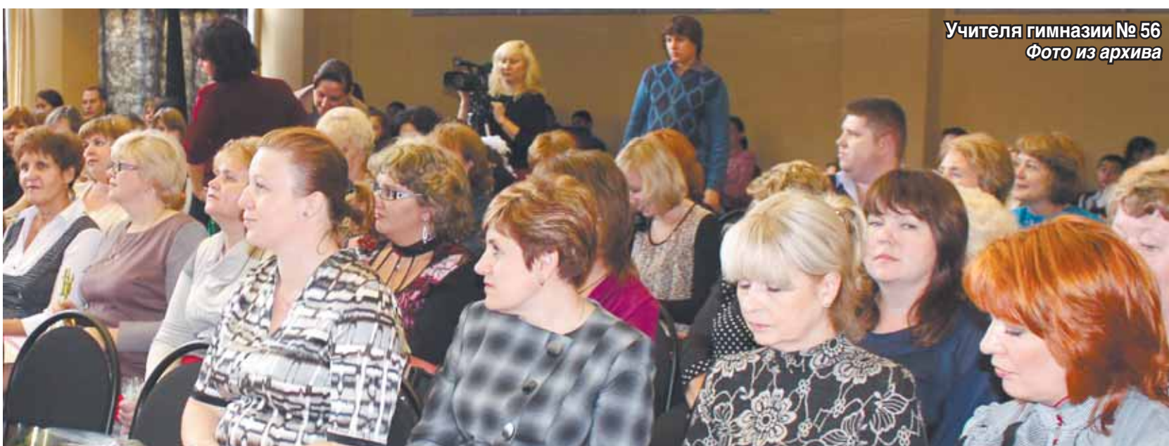
Учителя гимназии № 56