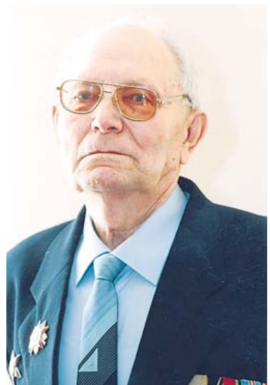
ЖИМОЛОСТЬ – ПЕРВАЯ ЯГОДА ЛЕТА

Все меньше остается в Подмосковье дачных участков, где не культивировалась бы жимолость. А если вы пока не решили пригласить ее на вашу плантацию, вот несколько аргументов, которые наверняка убедят вас в необходимости сделать это в ближайшие дни; ведь именно первая половина октября – оптимальное время для посадки этой перспективной культуры в нашей климатической зоне: