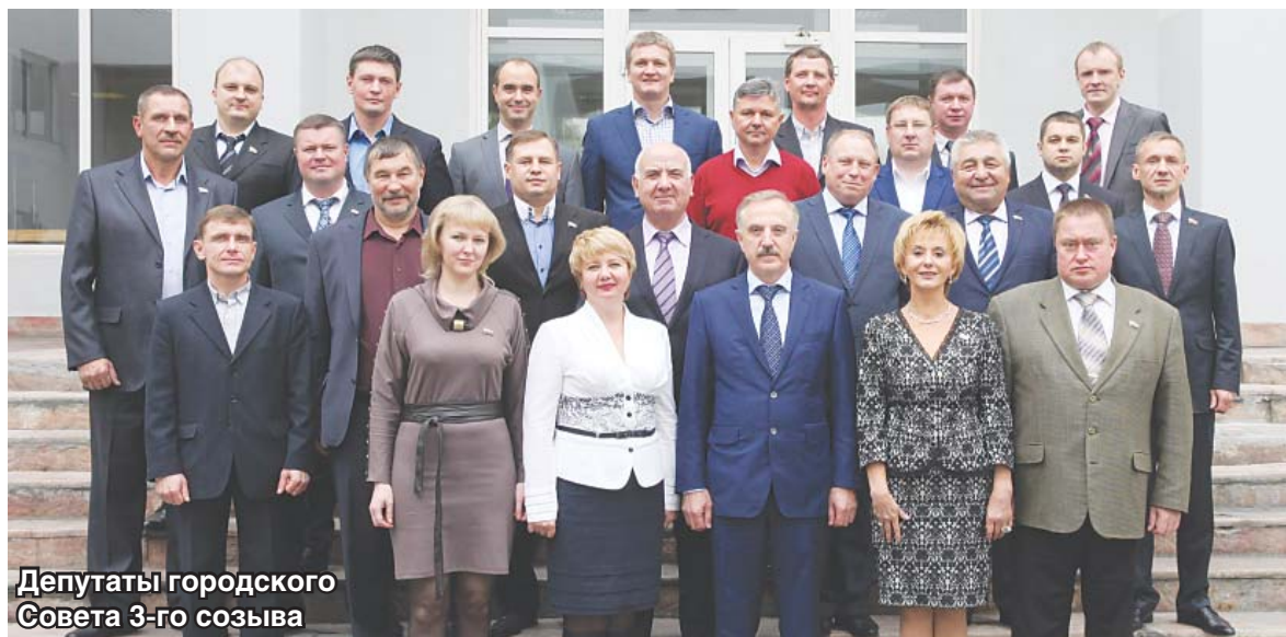
Депутаты городского Совета 3-го созыва

В понедельник, 29 сентября, в Люберцах состоялось первое заседание городского Совета депутатов третьего созыва.