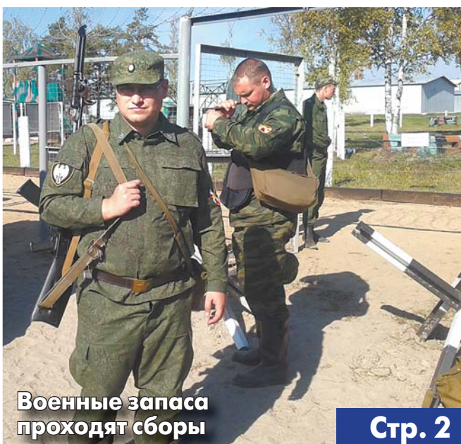
Военные запаса проходят сборы