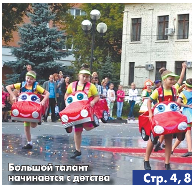
Большой талант начинается с детства