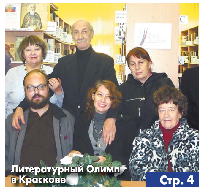
Литературный Олимп в Краскове