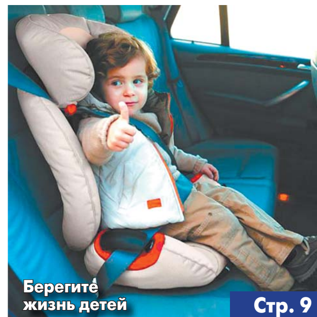
Берегите жизнь детей