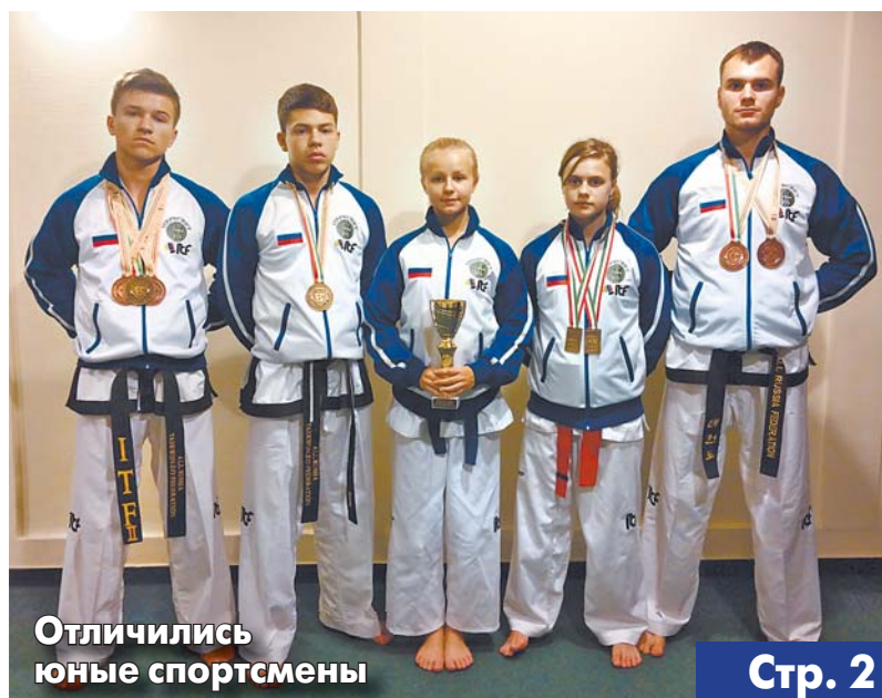
Отличились юные спортсмены

Этот адрес глава поместил на сайте администрации, и теперь в каждом номере газеты «Наше Красково сегодня» он будет публиковаться на видном месте. Таким образом, глава напрямую будет получать информацию от жителей.