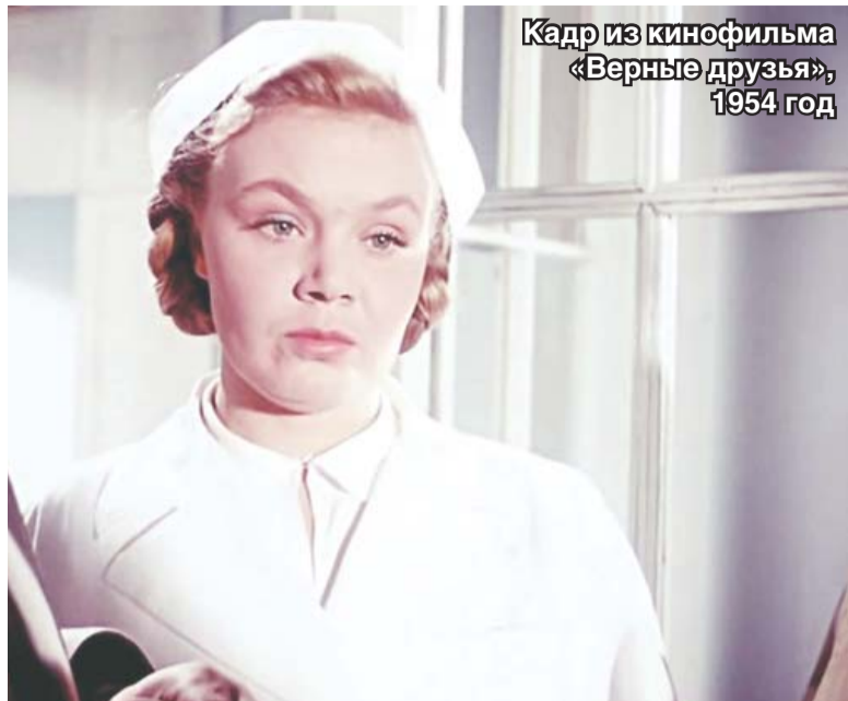
Кадр из кинофильма «Верные друзья», 1954 год