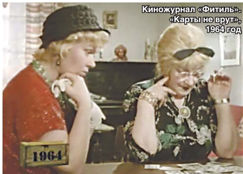
Киножурнал «Фитиль». «Карты не врут», 1964 год