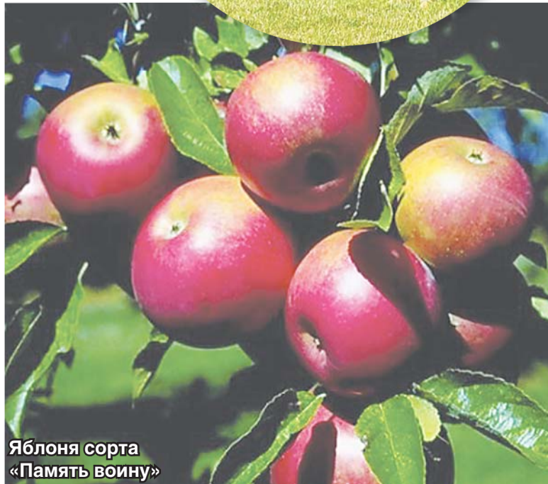
Яблоня сорта «Память воину»