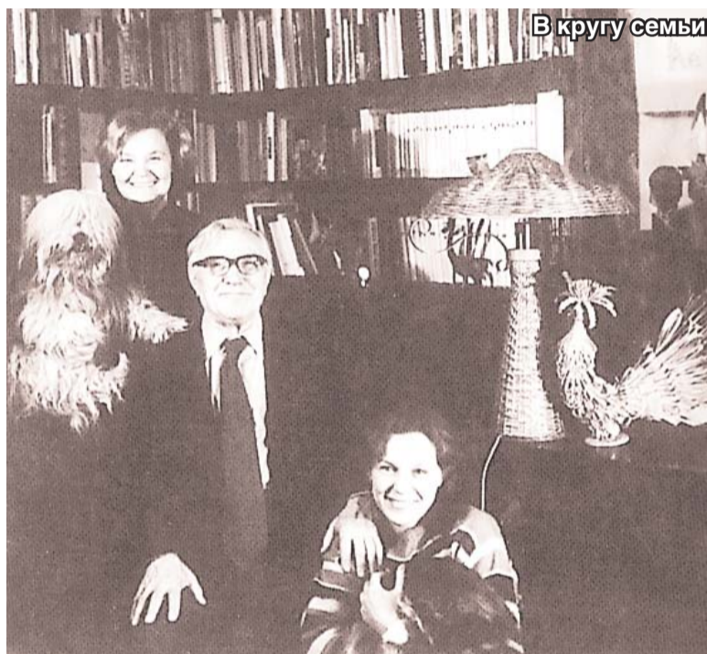
В кругу семьи

Положительные герои были мне безразличны, я любила играть стерж: ведь с «отрицателькой» работать интереснее. Всегда искала свой образ героини, когда можно на чём-то заострить зрительское внимание. И в театре все знали, что со мной лучше не спорить, в любом случае, я смогу настоять на своём. (Смеётся). Даже с режиссёрами во время репетиций порой не соглашалась, говорила им – что логично, что нелогично. Вследствие чего в театре меня