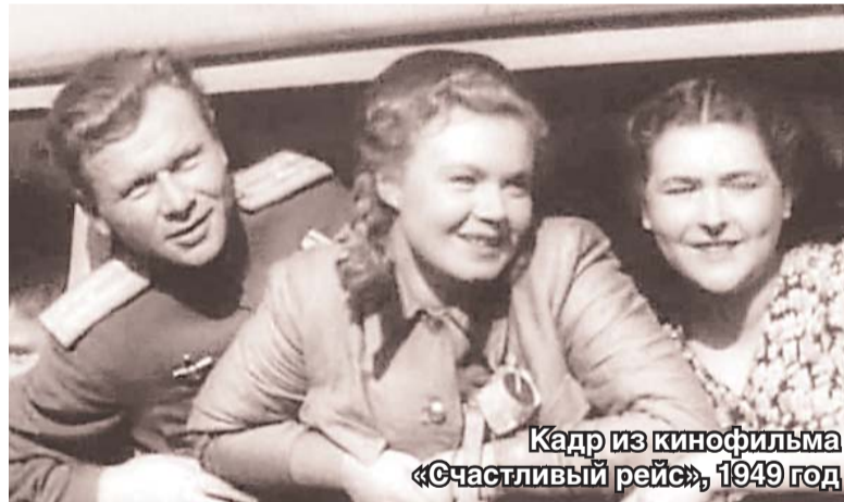
Кадр из кинофильма «Счастливый рейс», 1949 год

В 1951 году театр возглавил Борис Бабочкин, талантливейший актёр, но как художественный руководитель и режиссёр он был посредственным. Спустя год ему на