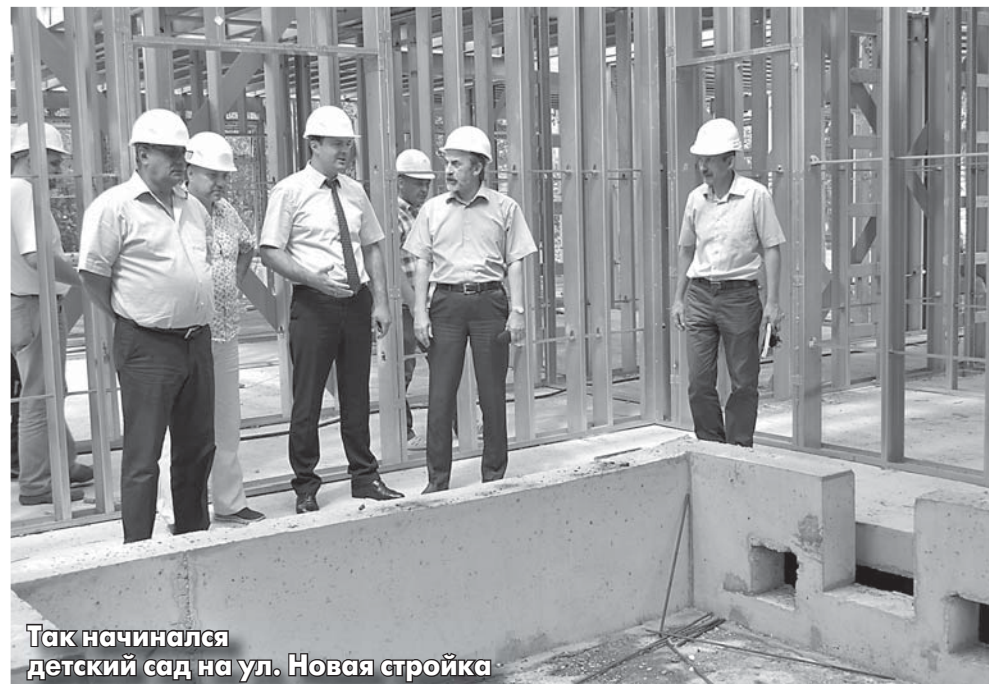
Так начинался детский сад на ул. Новая стройка

Администрация г.п. Красково взаимодействует с администрацией Люберецкого района по внесению до конца 2014 г. изменений в маршрутные карты автобусных сообщений, связывающих Красково и Люберцы, а также Красково и Москву для увеличения количества маршрутов с целью улучшения транспортной доступности.