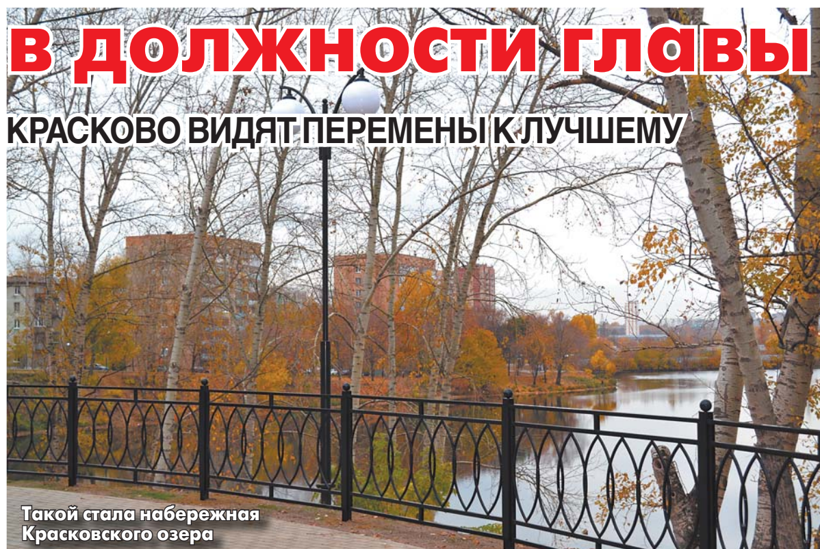
Такой стала набережная Красковского озера