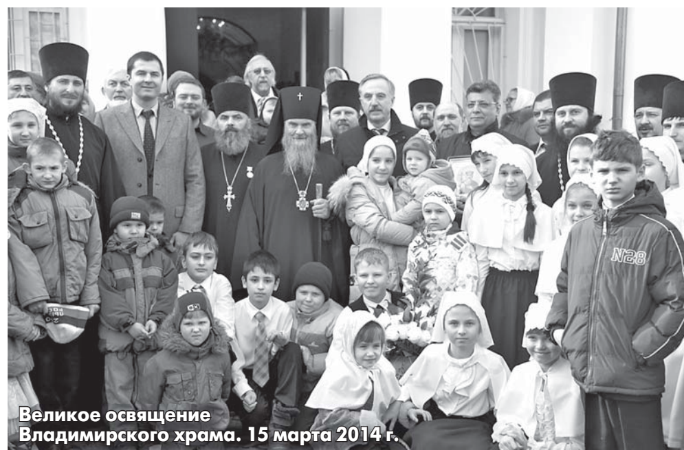
Великое освящение Владимирского храма. 15 марта 2014 г.

Наши ветераны ждали более 10 лет, когда в поселке будет открыт памятник воинам-красковчанам, павшим в годы Великой Отечественной войны 1941-45 гг.