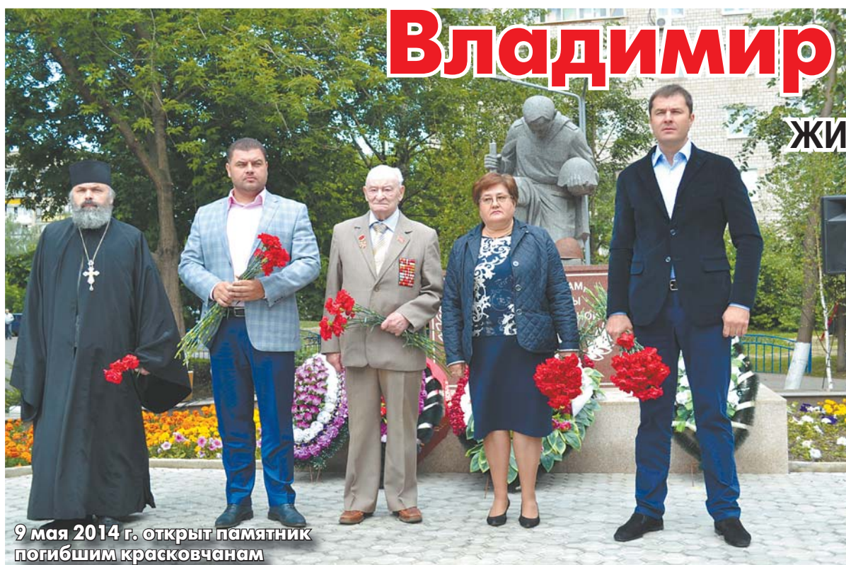
9 мая 2014 г. открыт памятник погибшим красковчанам