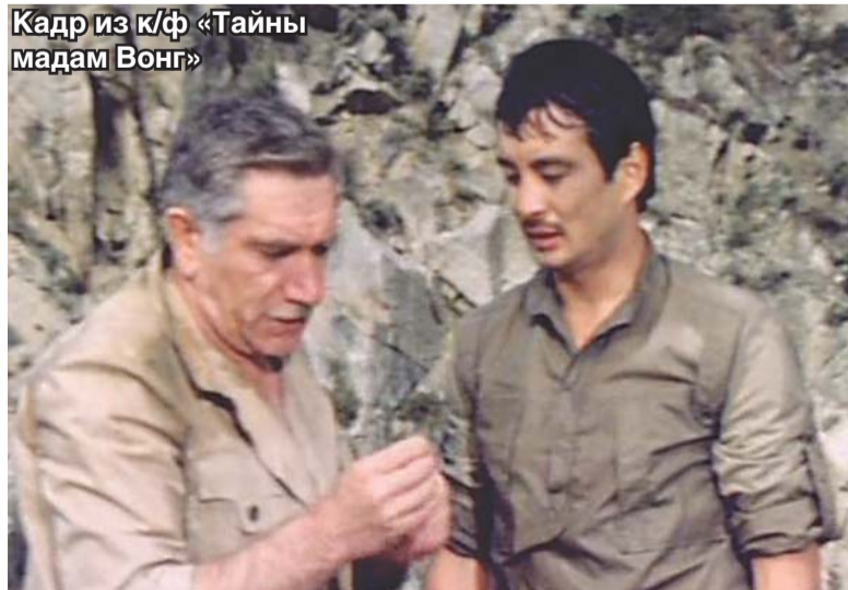
Кадр из к/ф «Тайны мадам Вонг»

Когда узнал трагическую новость, сначала хотел отказаться от этой картины. Но посоветовавшись