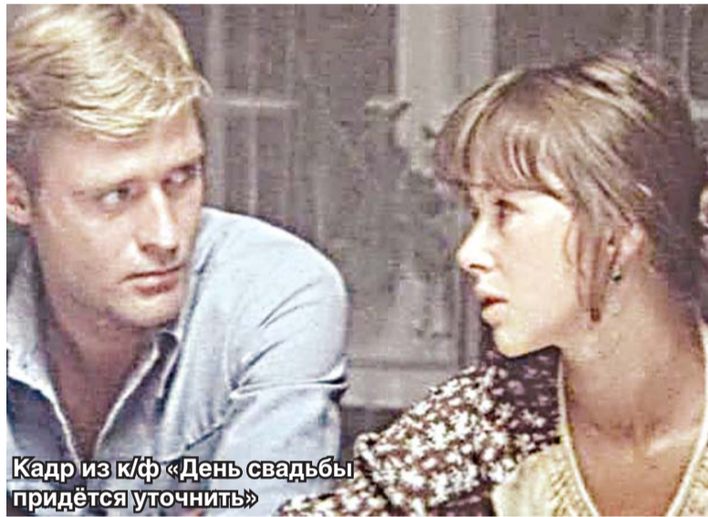
Кадр из к/ф «День свадьбы придётся уточнить»

«Что касается твоего вокала, Лёня, то «Америку я открывать не буду», а просто приглашу на озвучание поющего артиста, и ты будешь петь под фонограмму. Вопрос с вождением тоже решаем. Автомобиль будет стоять на специальной платформе, а тебе придётся только держаться за руль и имитировать езду на машине».