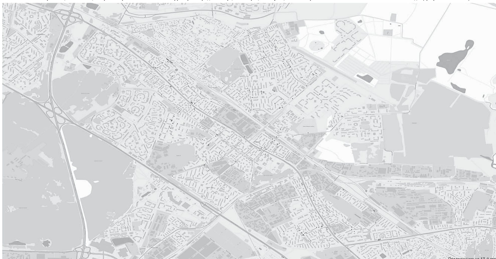
СХЕМА размещения нестационарных торговых объектов на территории города Люберецы Люберецкого муниципального района Московской области на 2014-2015 годы (графическая часть)

Приложение № 3 к постановлению администрации города Люберецы от 31.10.2014 № 2091-ПА Утверждена постановлением администрации города Люберецы от 18.12.2013 № 2052-ПА