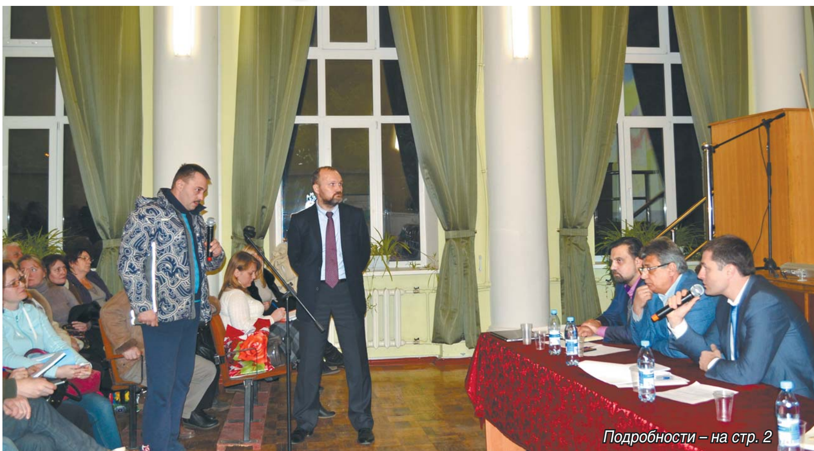
Подробности – на стр. 2