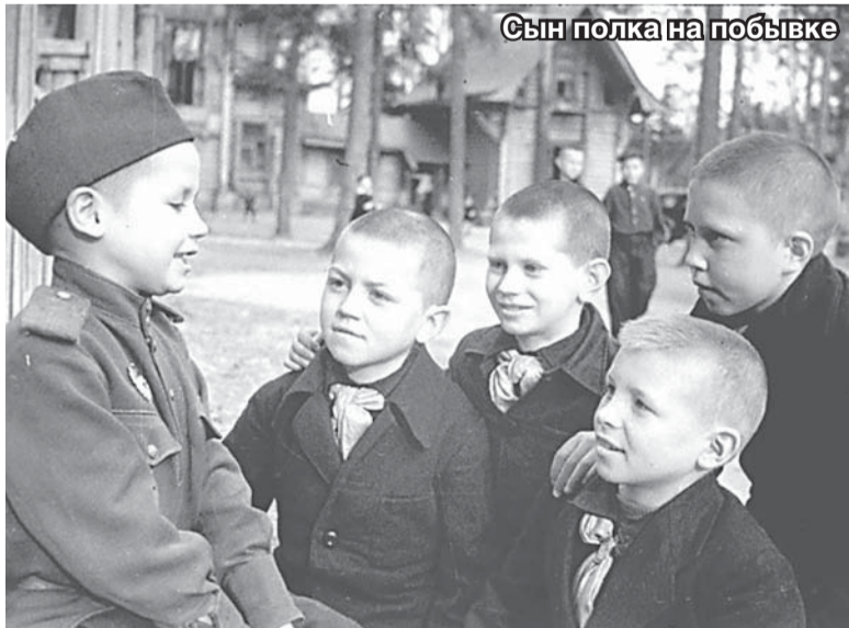
Сын полка на побывке

мы приглашаем как жителей Люберецкого района, так и тех, кто проживает (или проживал ранее) на территориях, ранее входивших в состав Ухтомского (с 1959 года