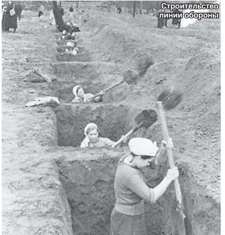
Строительство линии обороны