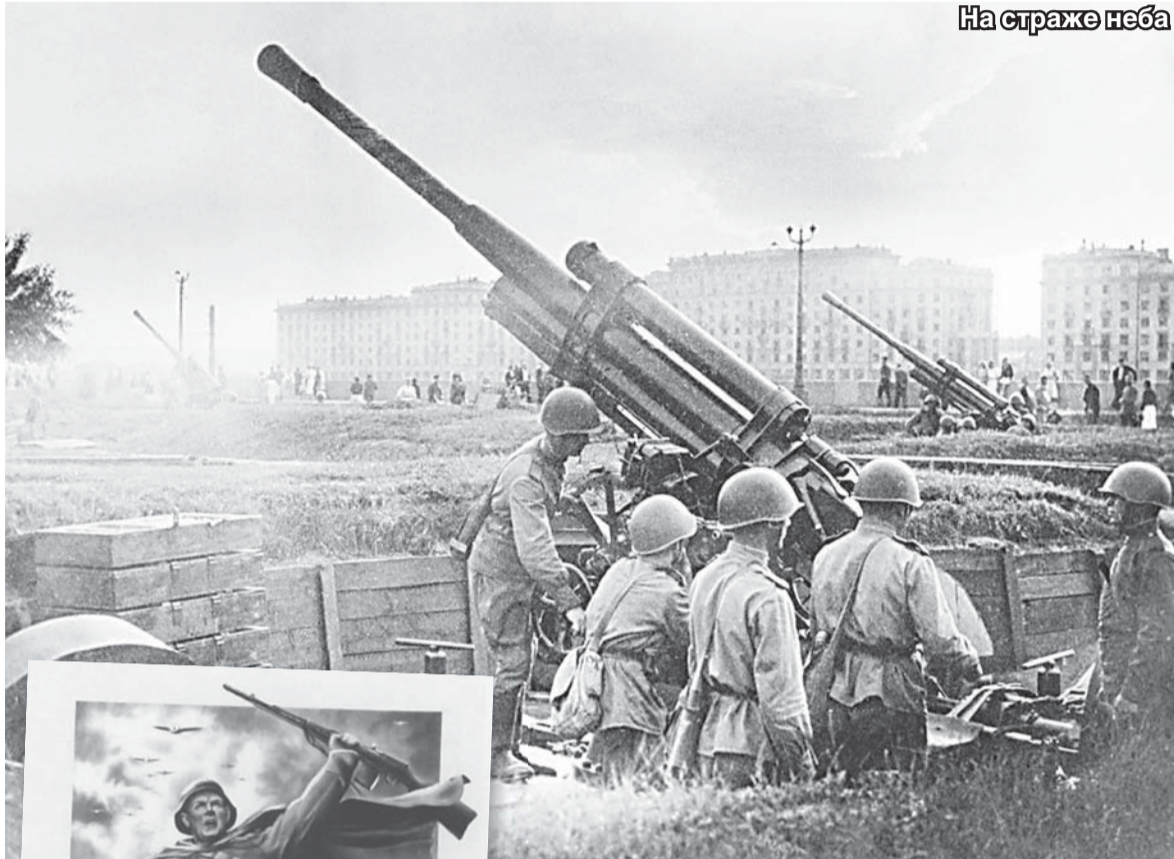
На страже неба