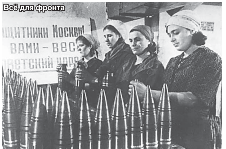
Всё для фронта

Всех, кто готов поучаствовать (на безвозмездной основе) в нашем проекте, поделиться своими воспоминаниями, внести предложения, замечания по его тематике, просим обращаться в редакцию «Люберецкой газеты». Ждем ваших звонков в будни по телефону: 8-495-554-40-39.